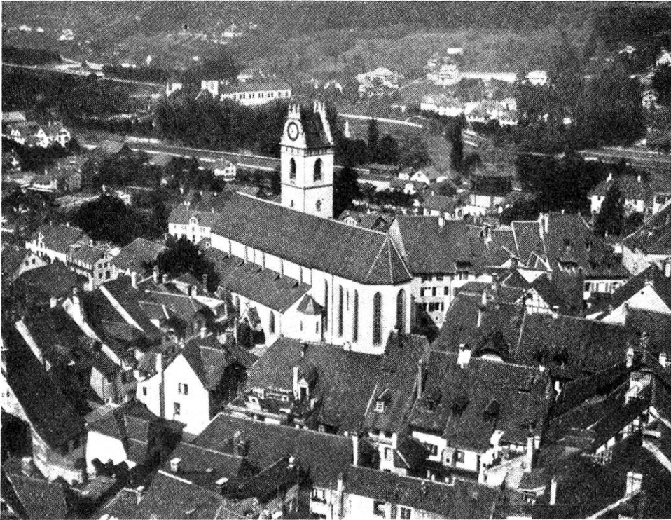
von der Plattform des Turmgerüstes

ersteigen, um sich die Stadt einmal von oben anzusehen und die schöne Aussicht zu genießen.