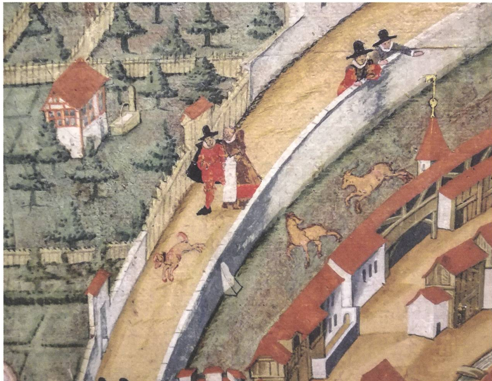
↑ Ein Ehepaar mit Hund spaziert am Hirschengraben entlang Richtung Laurenzentor. Detail aus der Stadtansicht von H.U. Fisch, 1612.

Nach der Gründung des Kantons Aargau schuf dieser Jungkanton schon bald eine eigene Hebammenschule, zu deren Händen mit dem 1805 in Aarau gedruckten Lehrbuch «Katechismus für die Hebammen des Kantons Aargau» ein wegweisendes Hilfsmittel entstand. Die Autorschaft desselben lag notabene bei einem Mann, dem Aarauer Chirurgen Heinrich Schmuziger (1776–1830).