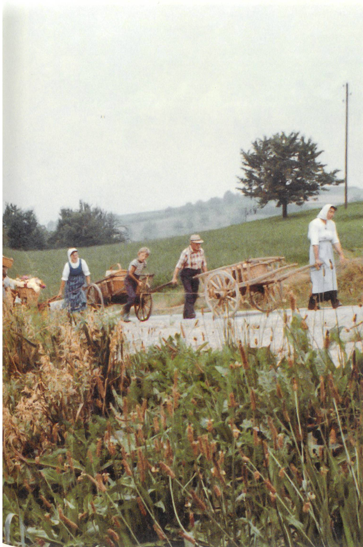
«Landenwagen» mit vorgespannter menschlicher Zugkraft (nachgestellt 1978).