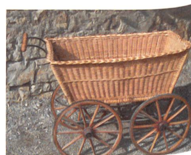
Diese alte Määrt-Scheese steht in einem Schopf in Oberhof.

Auch das Pflücken der Kirschen war eine harte Arbeit. Es wurde heiss auf den Bäumen, und die Mücken setzten einem zu. Wenn die Leiter nicht gut gesichert war, kam es immer wieder vor, dass jemand herunterfiel und verletzt oder gar tot liegen blieb. Und es presste immer, denn nur schöne und frische Früchte brachten Geld ins Haus.