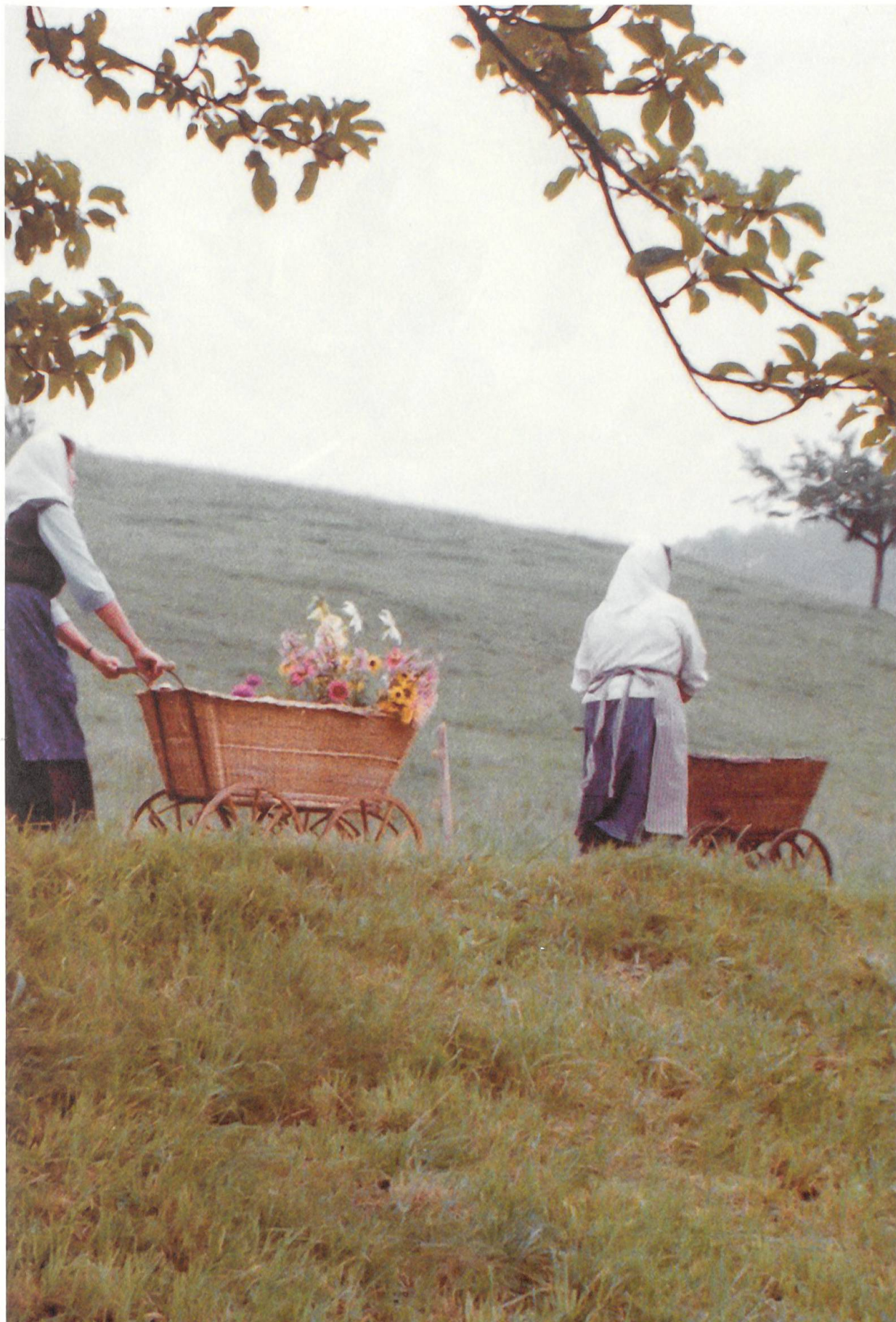
Die Marktleute auf dem 1978 nachgestellten Umzug zwischen Dorf und Benkenhöfen.