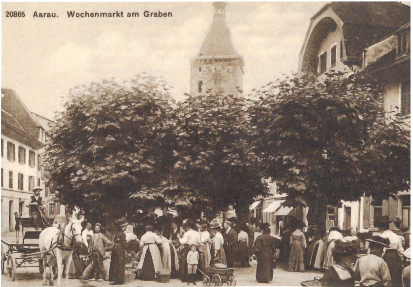
Markt am Graben um 1890.

Man lebte in Oberhof in der ersten Hälfte des letzten Jahrhunderts noch sehr traditionsbewusst. Grosse Familien, zum Teil mit zehn oder zwölf Kindern, waren keine Seltenheit. In vielen Häusern redeten noch in den 1940er-Jahren die Kinder ihre Eltern nicht mit «du» an, sondern mit «ihr»: «Vater, wie goht's ech?» und «Mueter, gänd er mer s Brot abe?»