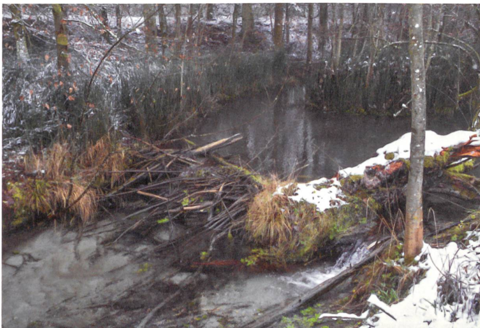
Neu entstandenes Feuchtgebiet hinter einem Biberdamm. Für einige Tiere kommt es der Sintflut gleich, und sie müssen ausweichen, für an- dere wird erst das Ter- rain für ihre Rückkehr vorbereitet.

1 Als Schlüsselart wird in der Ökologie eine Art bezeichnet, die im Vergleich zu ihrer ge- ringen Häufigkeit einen unverhältnismässig grossen Einfluss auf die Artenzusammensetzung einer Lebensgemein- schaft ausübt.