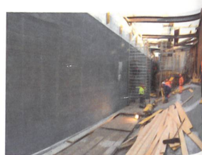
Die horizontal gerichteten Lamellen erzeugen eine für die Stromproduktion und die Lenkung von Fischen optimale Strömung.