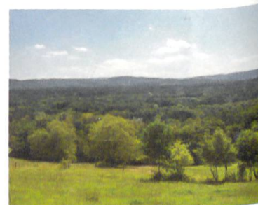
Blick von Biberstein ins Mittelland. Der grüne Gürtel durch besiedeltes Gebiet lässt die Korridorwirkung erahnen.

Migration und Emigration werden, wie bereits erwähnt, nicht einfach so ausgelöst. Es sind immer Triebkräfte nötig, um ein Tier dazu zu veranlassen, seinen jetzigen Standort zu verlassen. Genauso verhält es sich mit fremden Arten: Sie haben ihren Standortwechsel nicht selber eingeleitet, sondern sie wurden mittransportiert, freigelassen oder haben sich über neu entstandene Verbindungen ausgebreitet. Obwohl fremd, kommen sie mit neuen Umgebungen besser zurecht als manch einheimisches Tier. Eindrücklich kann dies am Beispiel von Flusskrebsen dargestellt werden. Nicht nur die Fremdlinge selber, sondern auch eine mitgebrachte Krankheit löschen einheimische Bestände langsam aber stetig aus. Bereits in den 1990er-Jahren war der aus Nordamerika stammende Kamberkrebs überall in der Mittelland-Aare anzutreffen. Gegenwärtig wird er seinerseits vom Signalkrebs (ebenfalls aus Nordamerika) verdrängt, wogegen er selbst, zusammen mit der Krebspest, den einheimischen Edelkrebs zum Aussterben gebracht hat. Hinter dem Begriff Krebspest verbirgt sich eine durch einen Eipilz ausgelöste Erkrankung bei einheimischen Flusskrebsen. Der befallene Krebs ist geschwächt und zeigt zunehmend Lähmungserscheinungen und Gliedmassenverluste, bevor er stirbt. Neue Tierarten können die örtlichen Verhältnisse derart