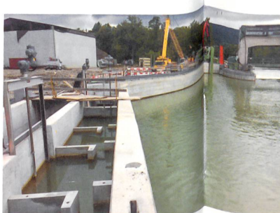
Links im Bild der Fischpass. Der Pfeil markiert den Bypass.

Vor gut 200 Jahren wurde der Biber ausgerottet, rund 100 Jahre vor dem letzten Bären. Das Biberfell, ein allheilendes Sekret (Bibergeil) sowie sein Fleisch waren in jener Zeit beliebte Güter zum Eigengebrauch oder für den Tauschhandel. Die Abwesenheit des grossen Nagers dauerte über 150 Jahre an. Dank dem Effort unter anderen des Kreisoberförsters Karl Rüedi aus Aarau wurden in der ganzen Schweiz in den 1960er- und 1970er-Jahren Biber aus Frankreich und Skandinavien wieder angesiedelt. Einige auch in Aarau selbst. Bis Ende der 1980er-Jahre waren dann auch permanent Biber anwesend, bis sie plötzlich verschwanden. Erst 1996 tauchten wieder Biber an der Zurlindeninsel auf und sind bis heute geblieben. Mittlerweile besiedeln wieder drei bis vier Biberfamilien die Gewässer auf dem Stadtgebiet von Aarau.