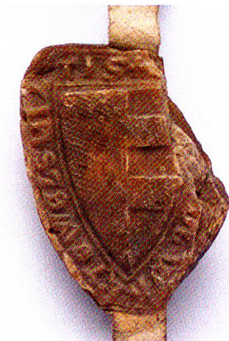
22 Siegel der Ritter von Wolen (Wohlen), Vögte in Baden ca. 1280–1345.