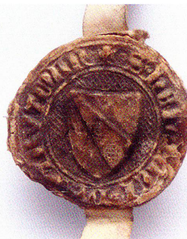
20 Siegel des Burgers und Sattlers Ulrich Freidig, 1341.