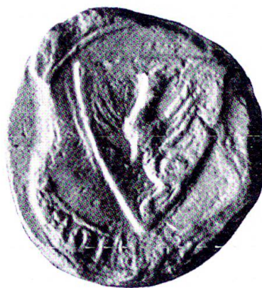
18 Siegel des Freiherren Marquard von Gösgen, 1367.