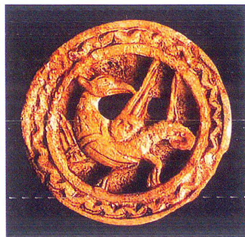
15 Drachenwappen des Ritters Peter von Oltingen, um 1333, Zürcher Wappenrolle.