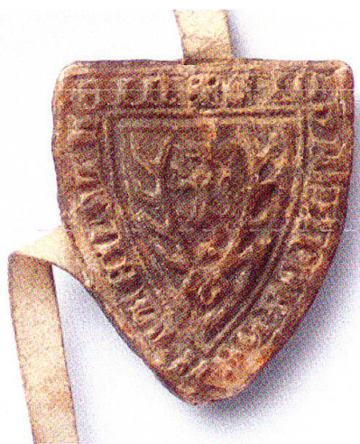
6 Siegel des Ritters Johans von Hertenstein, 13:3.

Die Häuser Kyburg und Habsburg strapazierten diesen Pfandgedanken. Die Abnahme ihres Besitzes zeigen Rödel und Urbare an. Ein Blick in ihre Rechnungen ergibt, dass im Aargau laufend Geld aufgenommen wurde. Das Kyburger Urbar entstand zwischen 1250 und 1264 und nannte viele Schweinezinse. Diese galten als Vogtsteuer, das heisst, damit galt man Schutz und Gericht ab. 13 Städte zahlten dazu Hofstättenzinse. In Aarau betrugen sie 60 Schilling. In