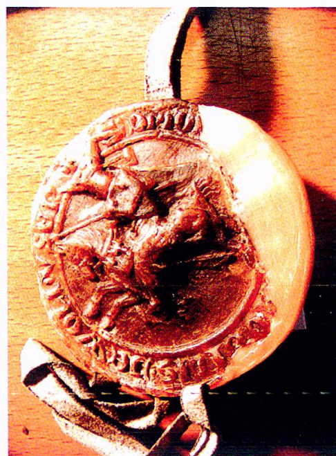
27 Helm-Siegel des sechsten Schultheissen, Rudolf von Wiggen, 1349.