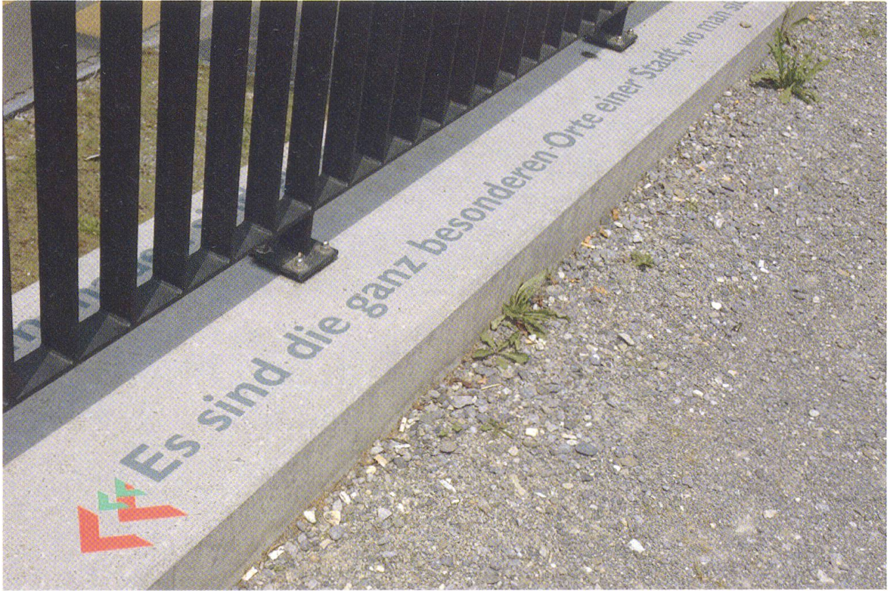
4 ...wo man sich zum Rendez-vous verabredet.» Ausschnitt aus den Zitaten am Laufmeter.