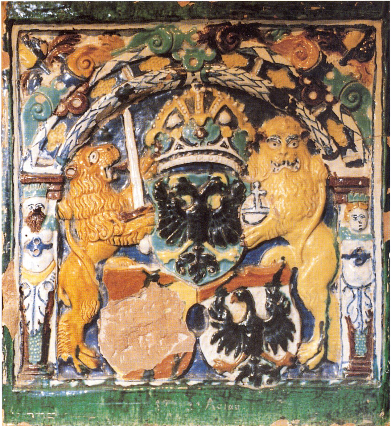
8 Wappenkachel, Lenzburg, 1590. Von Augustin Huber, Lenzburg, für das Rathaus in Aarau hergestellt. Polychrome Malerei. Historisches Museum des Kantons Aargau, Schloß Lenzburg, Inv. Nr. 3776. Unter bekröntem Reichswappen links Berner Wappen, rechts Aarauer Stadtwappen