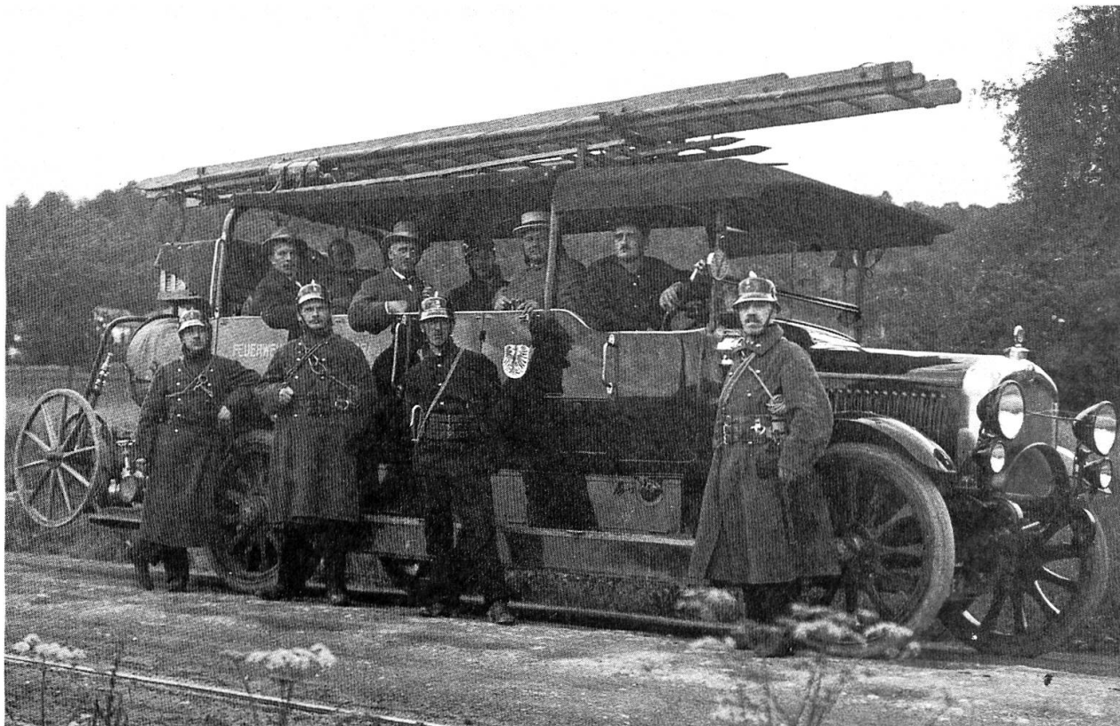
6 Das erste Aarauer Feuerwehrauto 1924 auf der Fahrt zu einem Wettspritzen in Zürich. Rechts außen der «Oberrichter», der auch die Aufnahme gemacht hat.

fung eines Pikettzuges (1901), der telefonisch alarmiert werden konnte, tat ein übriges, unser Löschwesen auf neuzeitlichen Stand zu bringen, was auch im Kanton draussen beachtet wurde.