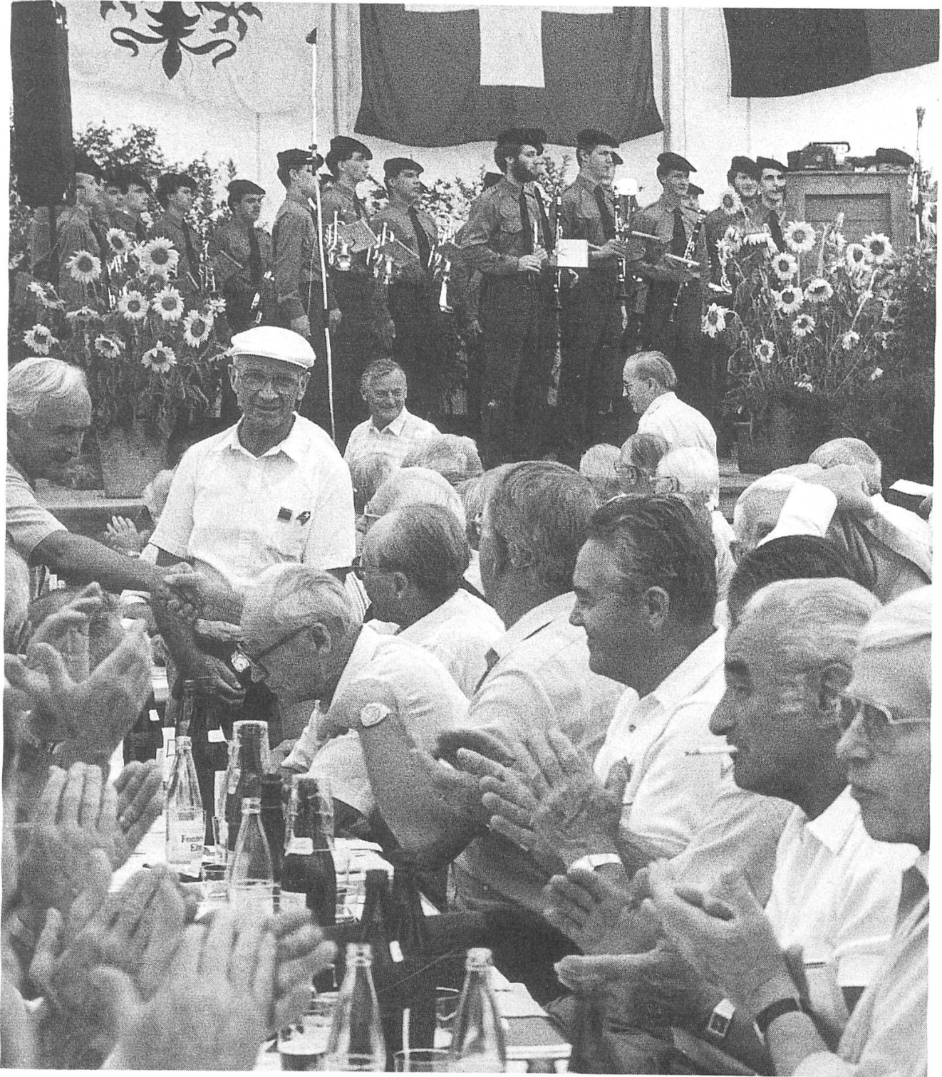
Suppe und Spatz für die Aktivdienst-Teilnehmer: Tausende fanden sich zu den Diamantfeiern ein.