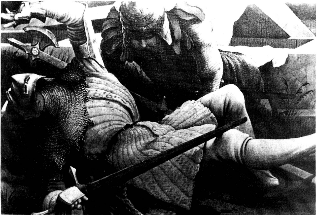
2 Wächter am Hl. Grab, Ausschnitt aus dem sogenannten Isenheimer oder Grünewald-Altar in Colmar. Zwei Wächter in Kriegsausrüstungen vom Ende des 14. Jahrhunderts. Vorne mit Beckenhaube, das Visier mit der «Hundsgugel» aufgeklappt, und Panzerhalsberge, gesteppter, verstärkter Waffenrock und Armschiene, hinten in Schuppenhelm und Panzerhemd

halb lassen sich für die wehrfähigen Bremgartner keine Zahlen ermitteln. Wir können nur sagen, daß mehr als die 70 namentlich erwähnten unter den elf Hauptleuten, dem Bannermeister und dem Schultheissen standen.