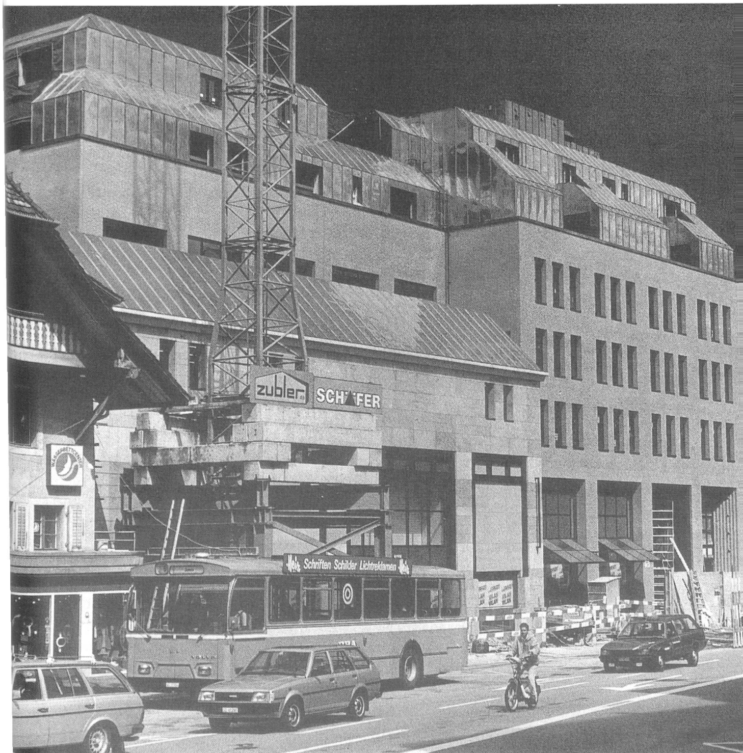
9 Neues Warenhaus mitten in der Stadt: der Vilan, kurz vor dem Abschluß der Bauarbeiten.