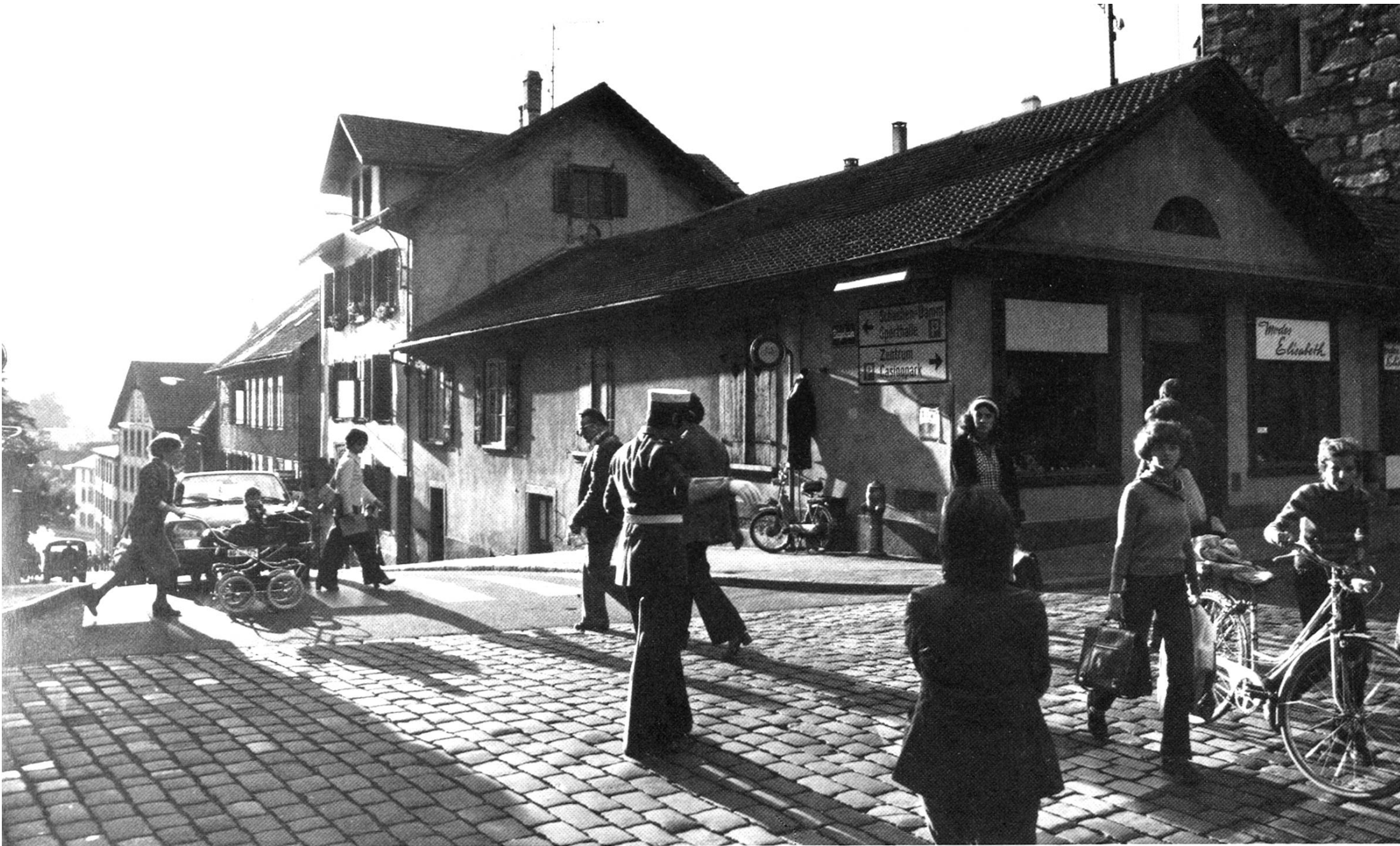
Abb. 4 Die ehemalige Landjägerwache erhält ihre besondere Bedeutung einerseits als Kopfbau der Häuserzeile am Ziegelrain, andererseits als typischer Vertreter der klassizistischen Bautradition in Aarau zu Beginn des 19. Jahrhunderts.