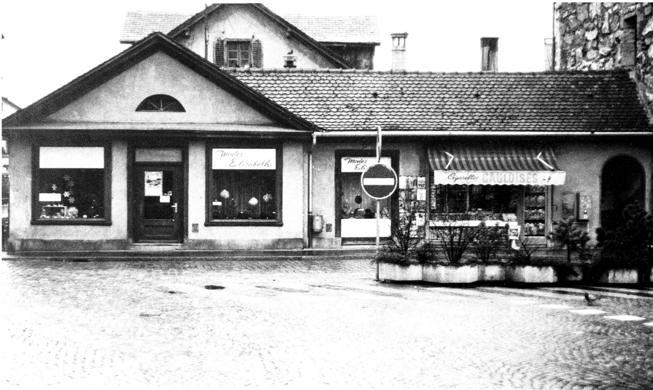
Abb. 2 Die ehemalige Landjägerwache heute. Der Dreiecksgiebel und die klare Gliederung der Fassade verraten etwas von der besonderen Baugeschichte des im Volksmund als «Gewerbehalle» bekannten Gebäudes.