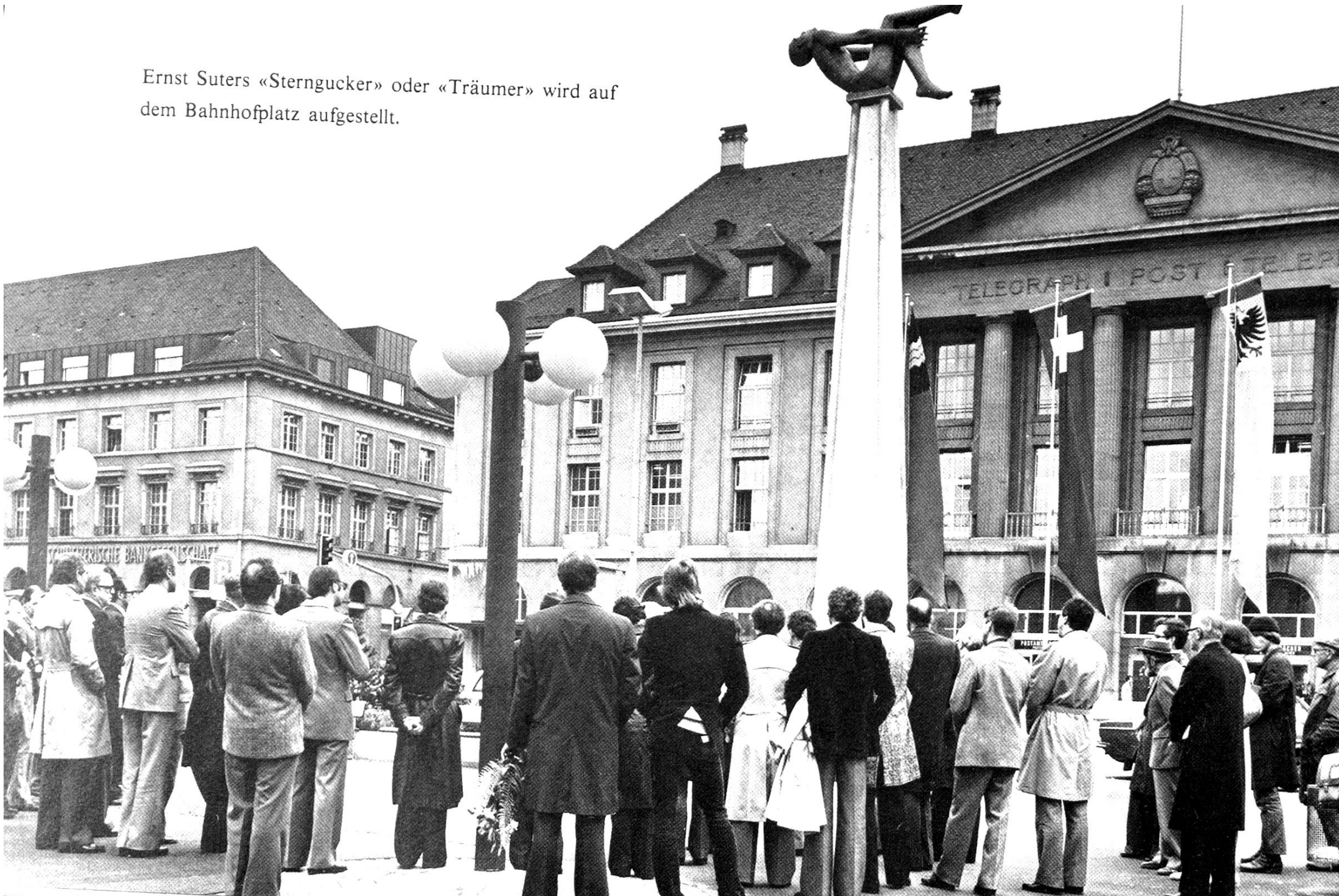
Ernst Suters «Sterngucker» oder «Träumer» wird auf dem Bahnhofplatz aufgestellt.