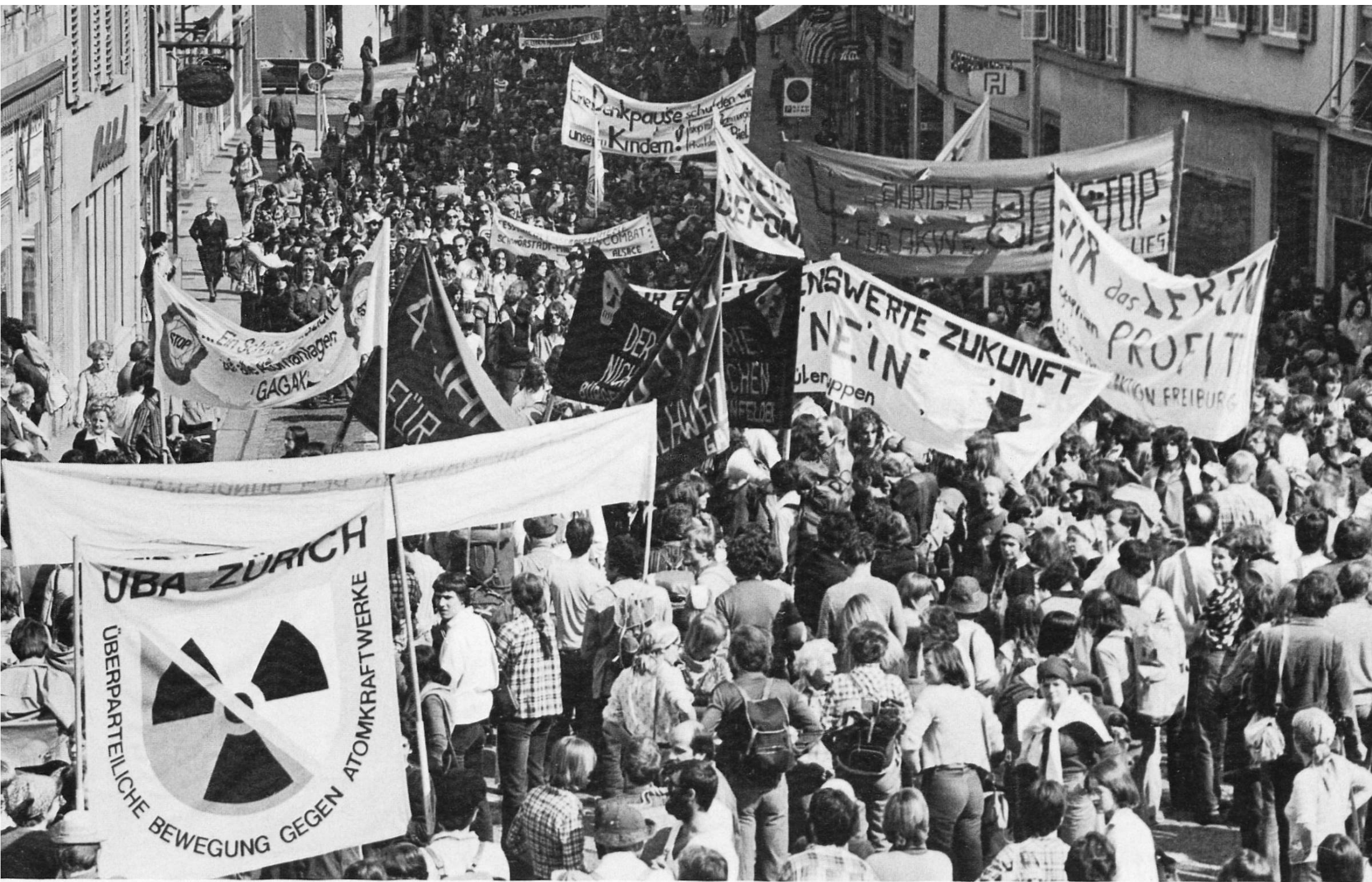
Aarau als Demonstrationsort der Kernkraftwerkgegner.