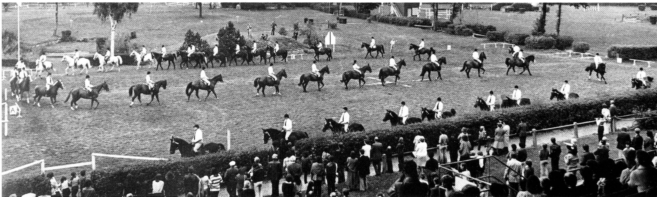
«Tag des Pferdes» auf der Rennbahn im Schachen und am Umzug durch die Innenstadt.