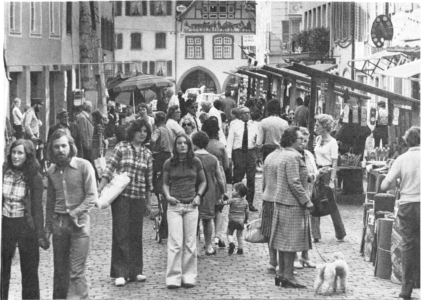
Während dreier Tage wurde die Pelzgasse verkehrsfrei gemacht, um den Leuten zu veranschaulichen, wie eine verkehrsarme Innenstadt überhaupt etwa aussehen könnte. Oben: Anlässlich einer kleinen Feier wurde die neue Tuchlaube, Theater und Jugendhaus, der Stadt übergeben.