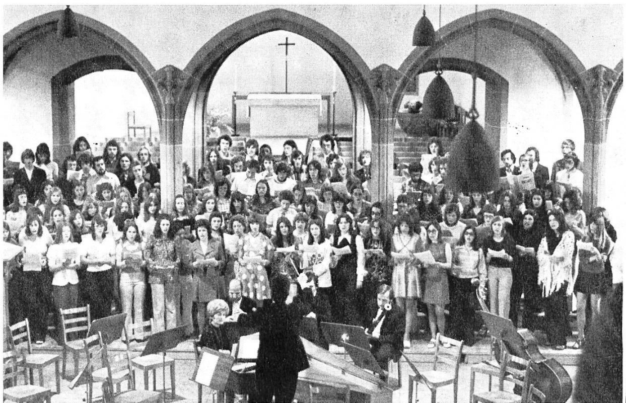
Ehrengäste am Maienzug 1973 waren die Schüler und Behörden von Ftan, wo die Stadt Aarau seit kurzem ein Ferienheim besitzt

Das Jahr 1973 stand im Zeichen verschiedener Jubiläumsfeiern zum 100jährigen Bestehen des Seminars in Aarau