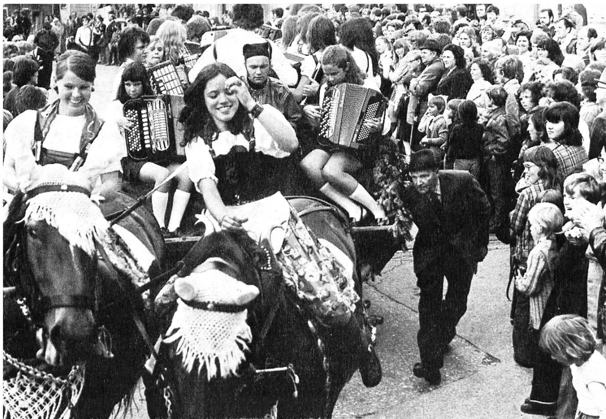
Stimmung und Fröhlichkeit brachte das Nordwestschweizerische Harmonika-Musikfest in die Gemeinde Küttigen

Das Jahr 1973 stand im Zeichen verschiedener Jubiläumsfeiern zum 100jährigen Bestehen des Seminars in Aarau