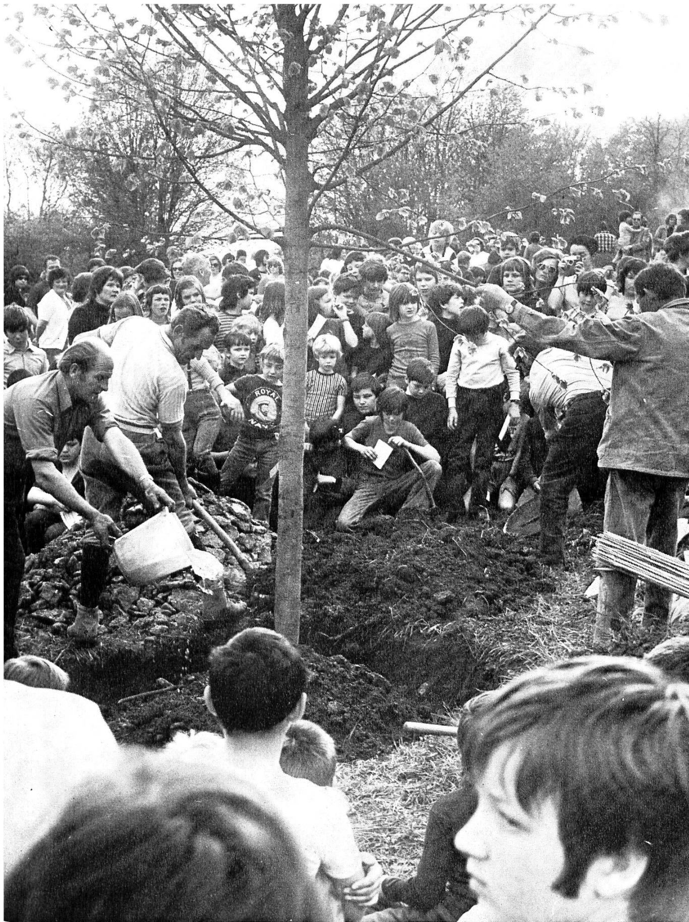
Anlässlich der 800-Jahr-Feier der drei Erlinsbacher Gemeinden wurde auf der «Gugenhalde» eine Jubiläums-Linde gepflanzt