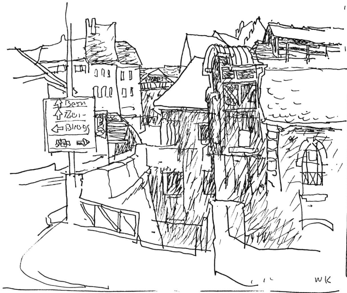
Zollrain mit Gasi

Frauen, weiss und gelbfüssig. Es war Ostermorgen. Der Hahn schrie in die leere Stadt. Die war vom vorösterlichen Getriebe müde. Müde waren die nicht verkauften Osterhasen, die Kleiderpuppen, die österlichen Rosen und Tulpen. Die Baustellen, die offenen Strassen, die Skelette der Häuser schliefen in den Morgen hinein, schliefen in der weissen Kälte. Die Plastic-Hüllen knallten im Wind, erschauerten, sogen sich an die Mauern und schwollen wie Ballone. Die Äste der Platanen griffen nach ihnen, zitterten und erstarrten. Vieles war am Ostersonntag nicht verkauft worden. Ich war allein in der Stadt, und ich überraschte sie ohne Schminke, nackt und angenagt. Die Häuser schliefen schamlos in den Morgen hinein. Ärmliche Toilette alter Damen, etwas abgeschabt, krampfaderig. Man hatte viele Hinterseiten