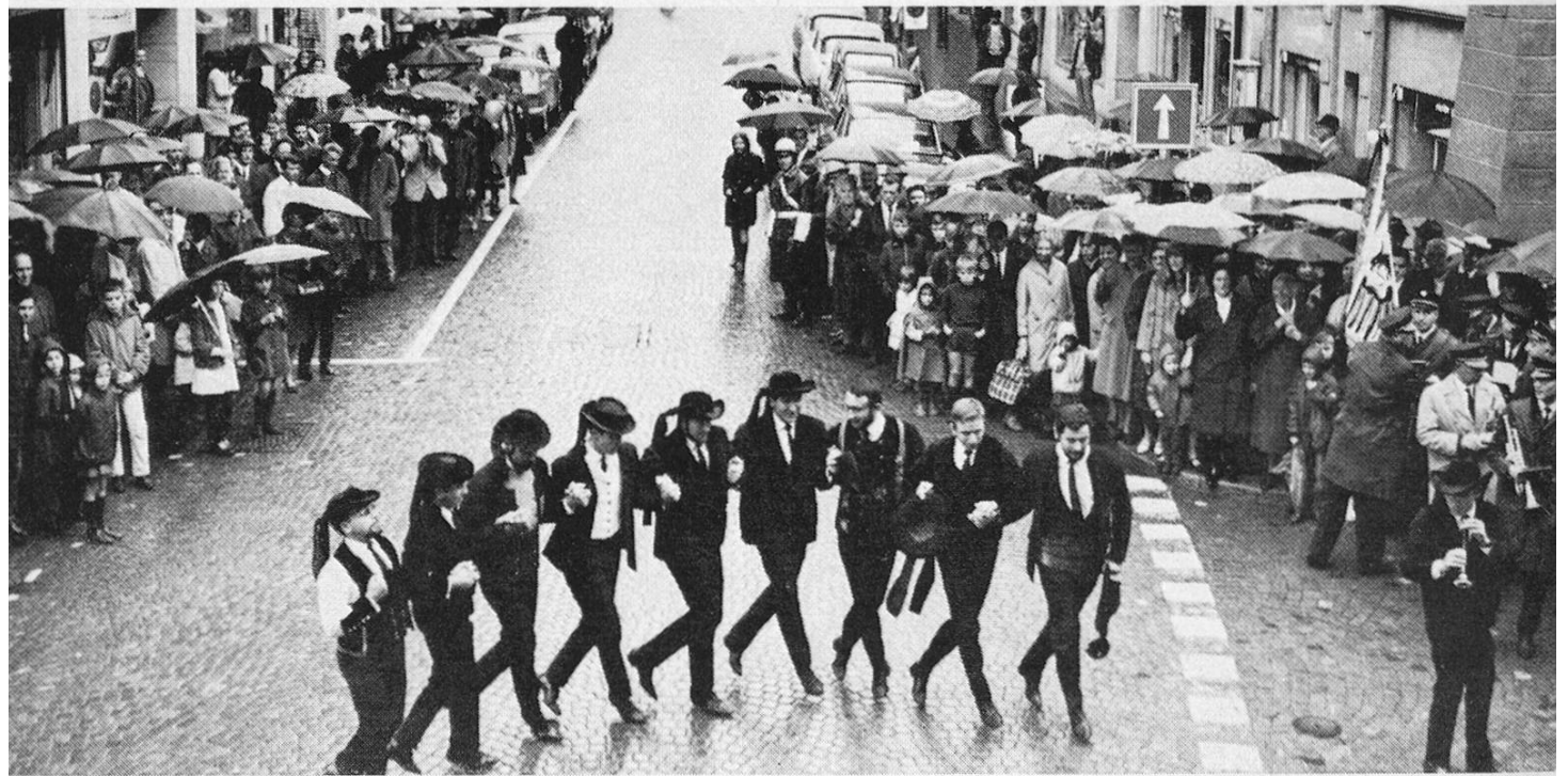
«Semaines Françaises» in Aarau! Vor dem Rathaus tanzte eine bretonische Folklore-Gruppe, und zwei Flics wurden des Aarauer Verkehrs Herr. Die ganze Stadt war auf Frankreich eingestellt.