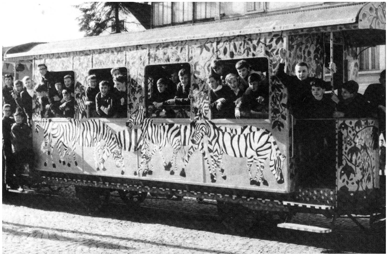
Schüler aus dem Wynen- und Suhrental bemalten die ausrangierten WSB-Wagen. Ein solcher diente auch den Seminaristinnen anlässlich des «Uselütete» (unten).