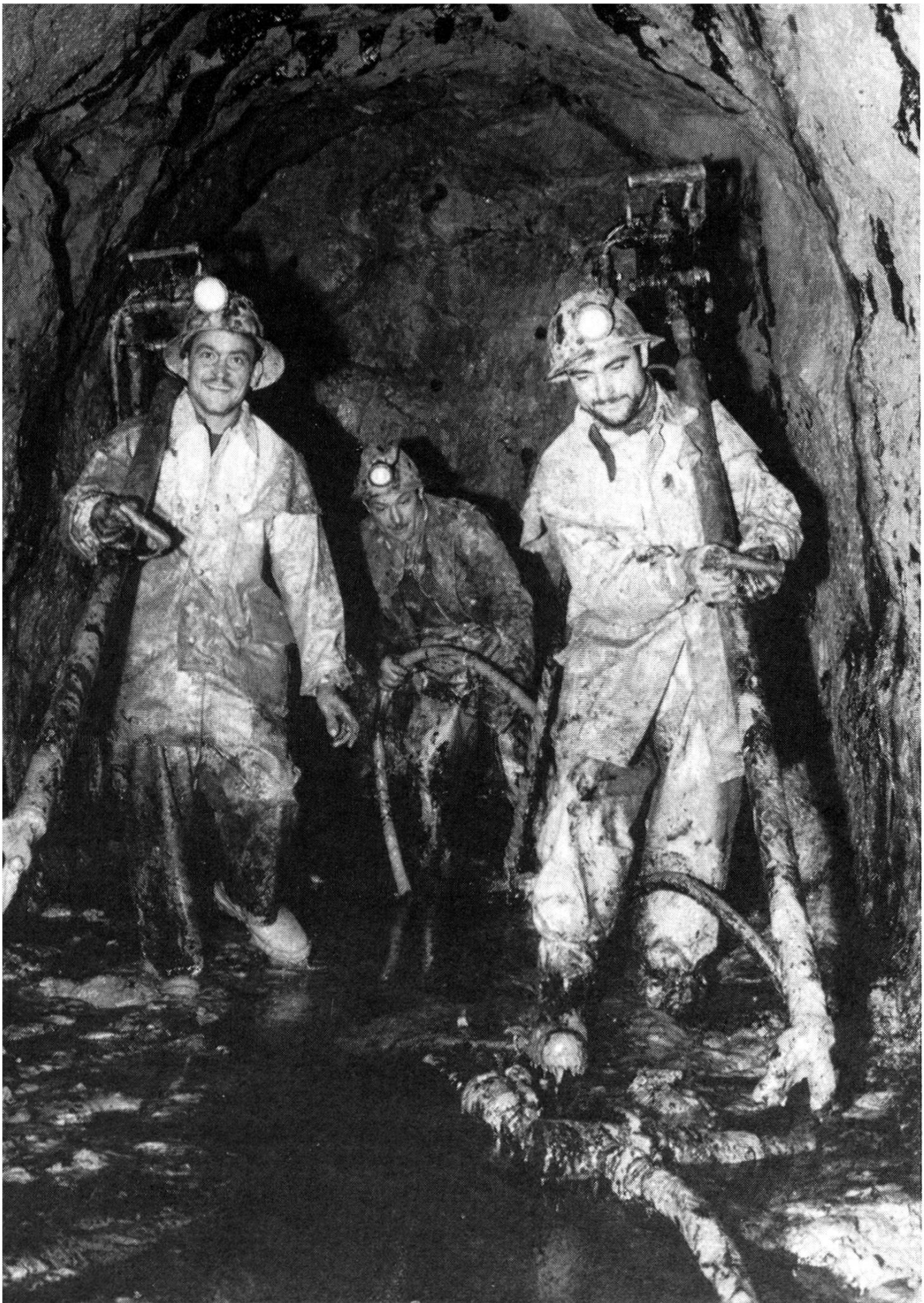
Beim Bau des Gönhardstollens, durch welchen das Abwasser aus dem Raume Entfelden zur im Bau befindlichen regionalen Kläranlage fliessen wird, stiessen die Stollenarbeiter auf Molasseöl.