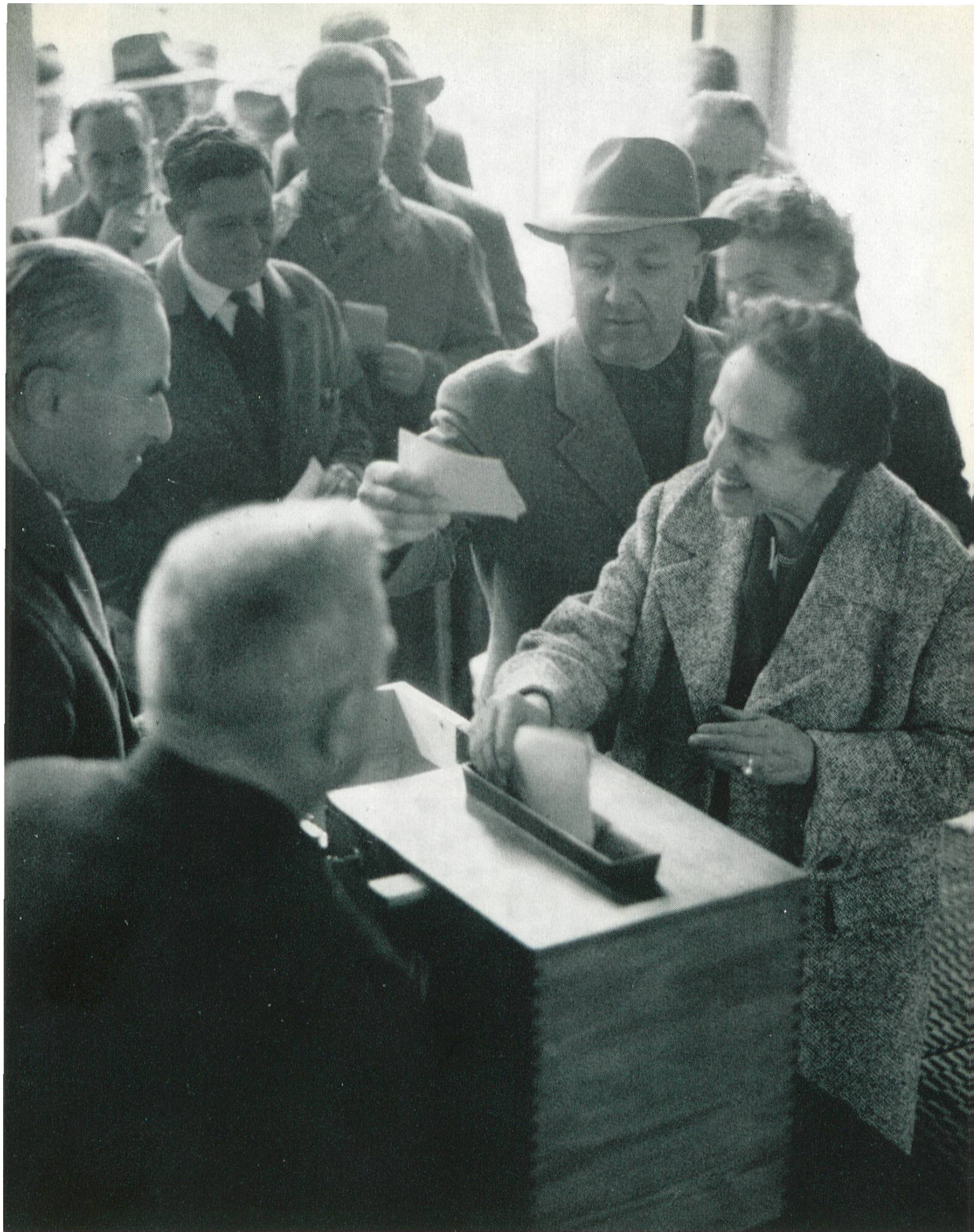
Die Aargauerinnen durften am 1. April erstmals ihre Stimme in kirchlichen Belangen an der Urne abgeben