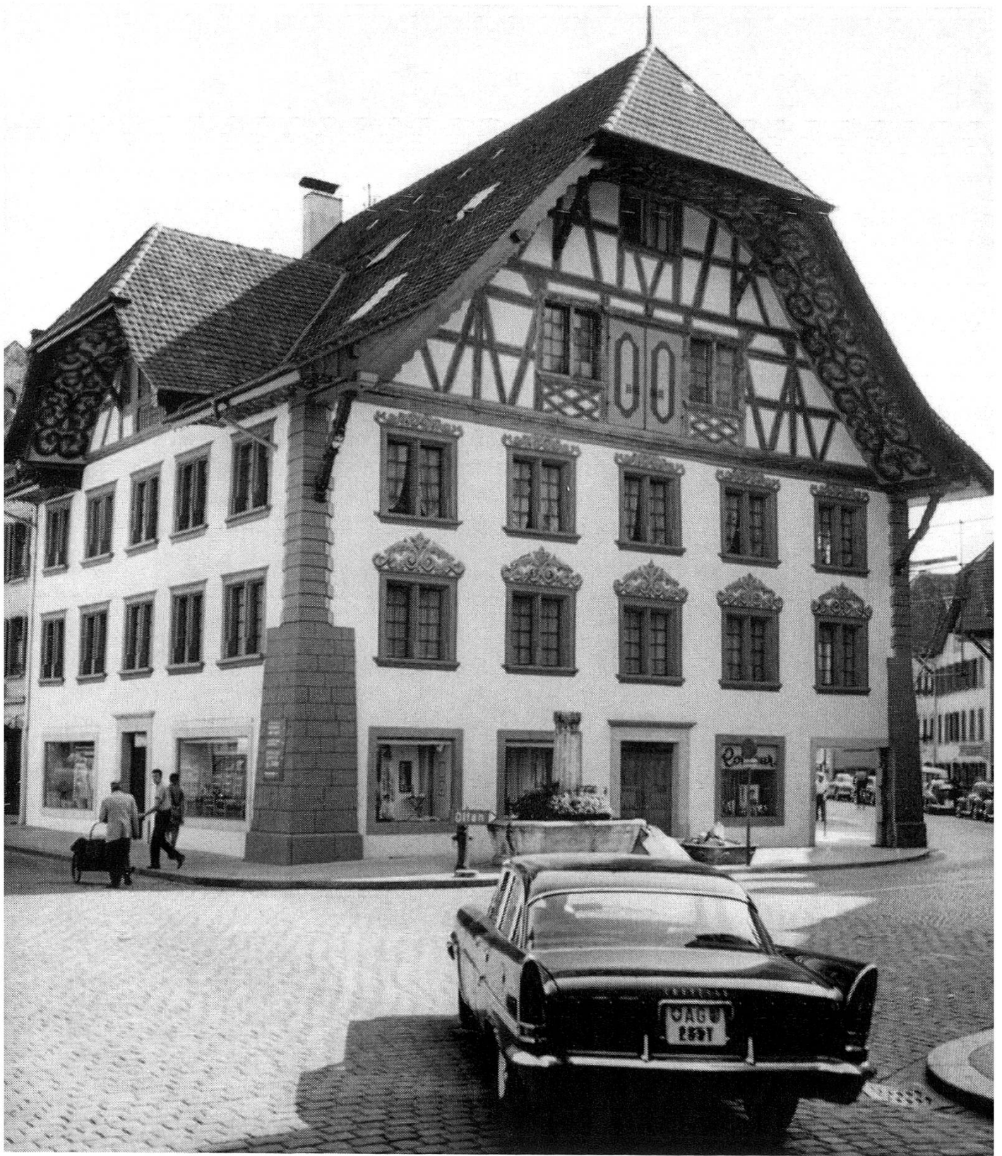
Das fachgemäß renovierte Saxerhaus (Vordere Vorstadt Nr. 8) erscheint erstmals urkundlich am 15. Januar 1344 als Spital, in welchem Schwestern, vermutlich vom Dritten Orden des hl. Dominikus, wirkten und wo die Bürgerschaft vor dem 6. Juni 1364 einen St.-Nikolaus-Altar für einen speziellen Spitalkaplan stiftete. Ab 1533 beherbergte das Haus auch Aaraus erste deutschsprachige Schule. Seine heutige Gestalt erhielt das Haus 1693, als das Spital ins ehemalige Haldenkloster disloziert war. Jahrhunderte lang bildete es den Scheitelpunkt einer vermutlich vor Aaraus Stadtgründung zurückgehenden Flurgrenze, genannt «zen Husen».