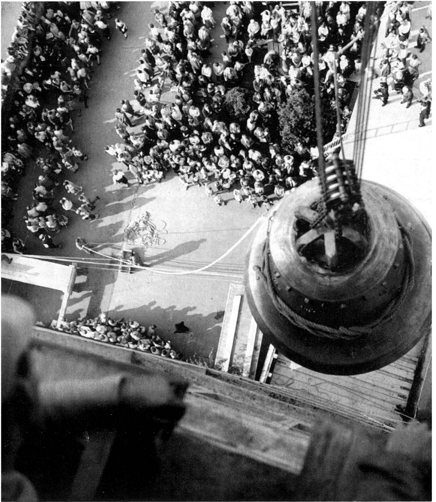
Die Römisch-katholische Kirchgemeinde konnte am 24. September 1960 ihr neues, sechsstimmiges Geläute weihen. Anderntags vollzog die Schuljugend feierlich den Aufzug des Geläutes, das in der Aarauer Glockengießerei gegossen worden war.