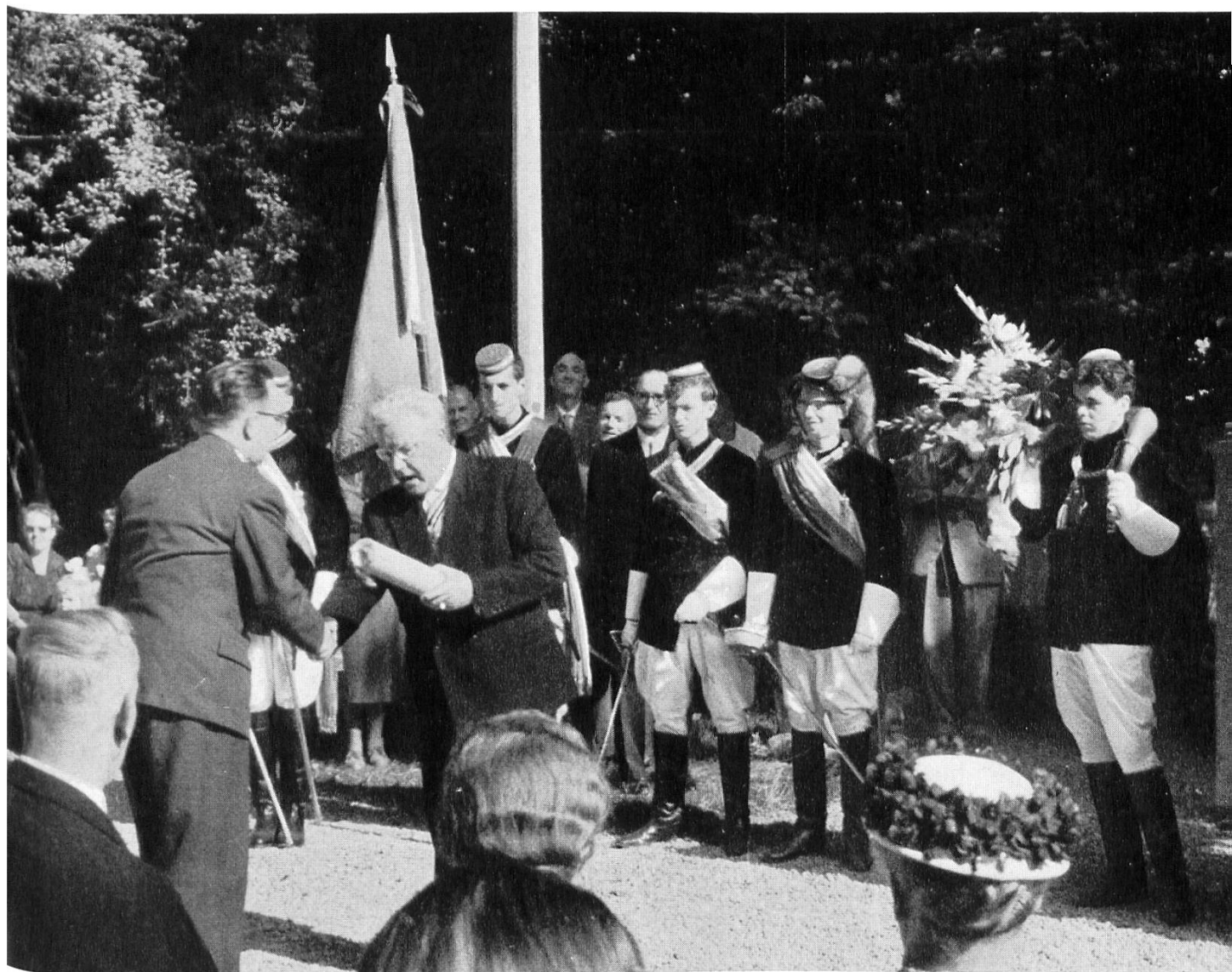
100 Jahre Kantonsschülerverbindung Industria Aarau. Übergabe des Geschenkes von 5000.- Franken an die Kantonsschule. 29./30. August.