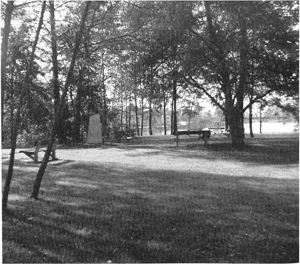
Die neuen Anlagen auf der Insel beim Zurlindensteg mit dem Gedenkstein