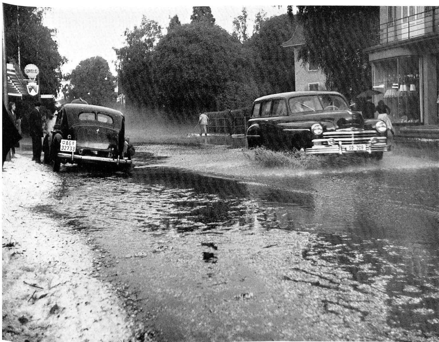
Am 1. August 1955 ging ein schweres Unwetter über Aarau nieder