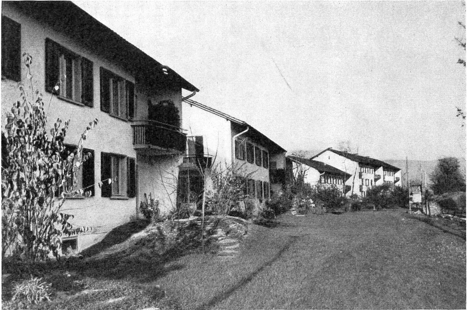
Allgemeine Wohnbaugenossenschaft Marau und Umgebung, ABAU, Telfi