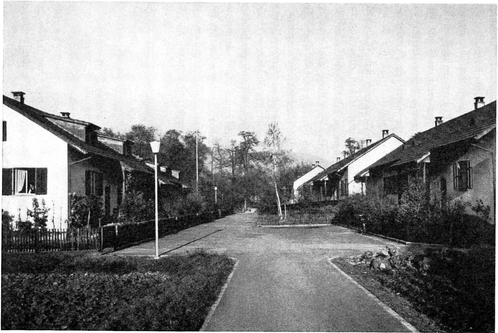
Wohnbaugenossenschaft Marau 1942, Scheibbschachen