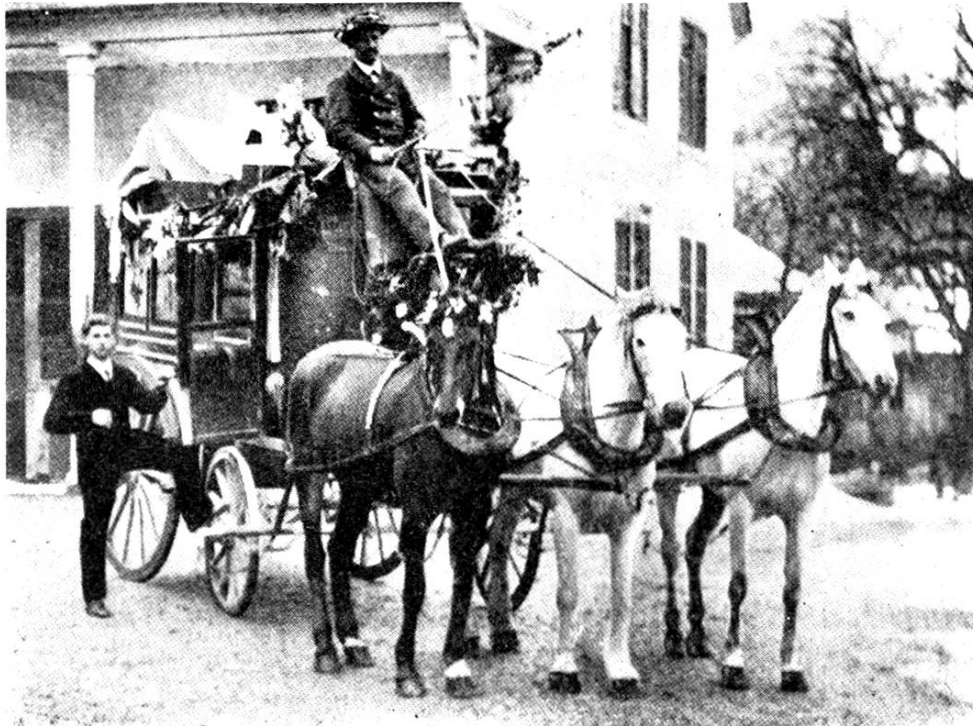
Die letzte Post vom Wönental 5. März 1904 Abfahrt beim Postbureau Mönziken

1852 bis Ende 1853, gehörten die Kantone Solothurn, Basel, Aargau, Luzern, Unterwalden und Schwyz zum 2. Kreis: Zofingen. Ende 1853 erfolgte die Verlegung der Inspektion von Zofingen nach Bern, wohin nun auch das Kassenwesen kam. Das Jahr 1866 brachte eine neue Kreiseinteilung des Telegraphen mit sechs Inspektionskreisen, wovon einer Olten war. Nun war wieder die Kreispostkasse Aarau zugleich Telegraphenkasse des Kreises Olten. Das brachte selbstverständlich auch der Post in Aarau, zuerst dem Briefbureau und später, als der Mandatdienst von diesem abgetrennt wurde, 1905, dem Mandatbureau, vermehrte Arbeit, denn alle Zahlungen, auch die Besoldungen an die Telegraphenämter und umgekehrt die Zahlungen der Telegraphenämter an die Kreistelegraphenkasse wurden mittelst Postanweisungen vollzogen.