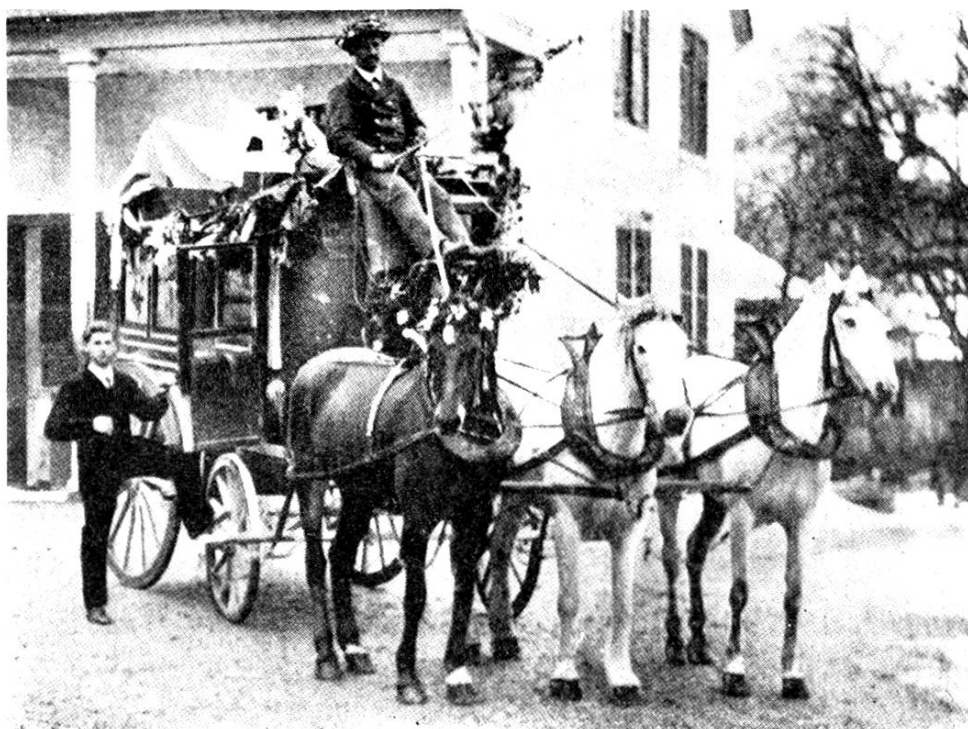
Die letzte Post vom Wonnental 5. März 1904 Abfahrt beim Postbureau Mönziken

1852 bis Ende 1853, gehörten die Kantone Solothurn, Basel, Aargau, Luzern, Unterwalden und Schwyz zum 2. Kreis: Zofingen. Ende 1853 erfolgte die Verlegung der Inspektion von Zofingen nach Bern, wohin nun auch das Kassenwesen kam. Das Jahr 1866 brachte eine neue Kreiseinteilung des Telegraphen mit sechs Inspektionskreisen, wovon einer Olten war. Nun war wieder die Kreispostkasse Aarau zugleich Telegraphenkasse des Kreises Olten. Das brachte selbstverständlich auch der Post in Aarau, zuerst dem Briefbureau und später, als der Mandatdienst von diesem abgetrennt wurde, 1905, dem Mandatbureau, vermehrte Arbeit, denn alle Zahlungen, auch die Besoldungen an die Telegraphenämter und umgekehrt die Zahlungen der Telegraphenämter an die Kreistelegraphenkasse wurden mittelst Postanweisungen vollzogen.