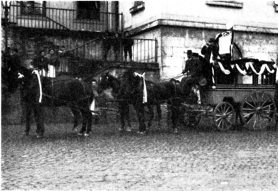
Letzte Post Echöstland—Narau am 19. November 1901 Normalerweise wurde die Post von Narau ins Euhrental zweispännig geführt, dreimal täglich

Postdienst spielten, wurde insbesondere durch den Postcheckverkehr, eingeführt im Jahre 1906, nach und nach der Lebensfaden abgeschnitten. In Narau wurde die Kasse Ende 1920 aufgehoben. Einen Teil ihrer Funktionen übernahm das Geldpostamt.