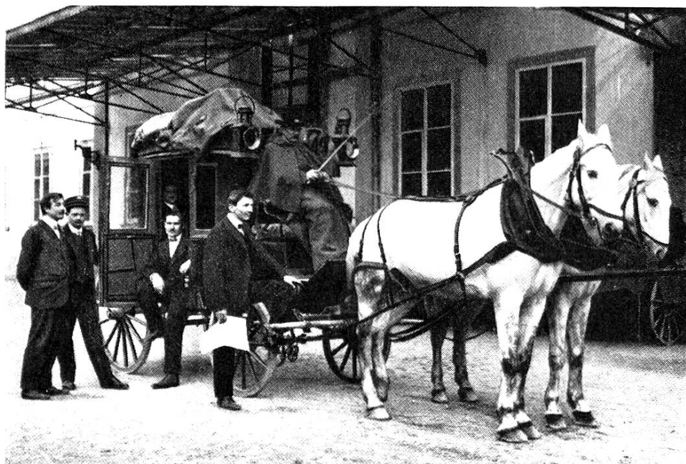
Gricke Post, 1923 durch das Postauto ersetzt

zug vom alten ins neue Gebäude erfolgte in der Nacht vom 14./15. Juli 1915. Nach der Durchfahrt des Nachtzugs konnte das Briefamt erst die endgültige Räumung vornehmen.