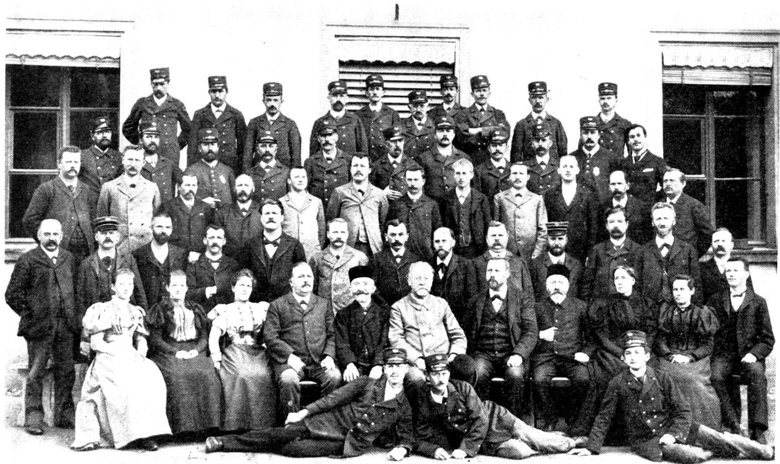
Photographische Aufnahme des Postpersonals vom Jahre 1897 im Hof des alten Postgebäudes (jetzt Aargauisches Elektrizitätswerk)