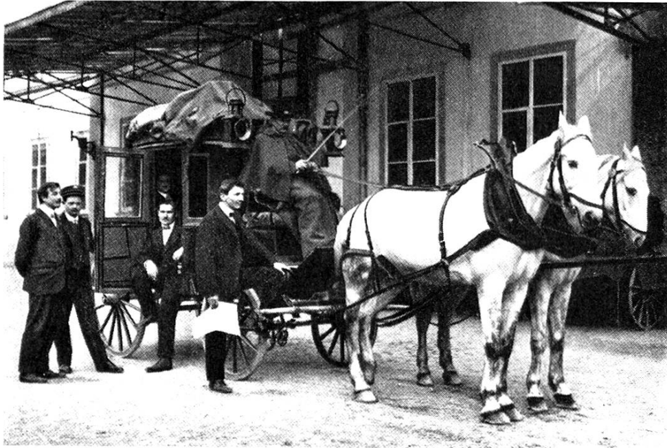
Gricke Post, 1923 durch das Postauto ersetzt

zug vom alten ins neue Gebäude erfolgte in der Nacht vom 14./15. Juli 1915. Nach der Durchfahrt des Nachtzugs konnte das Briefamt erst die endgültige Räumung vornehmen.