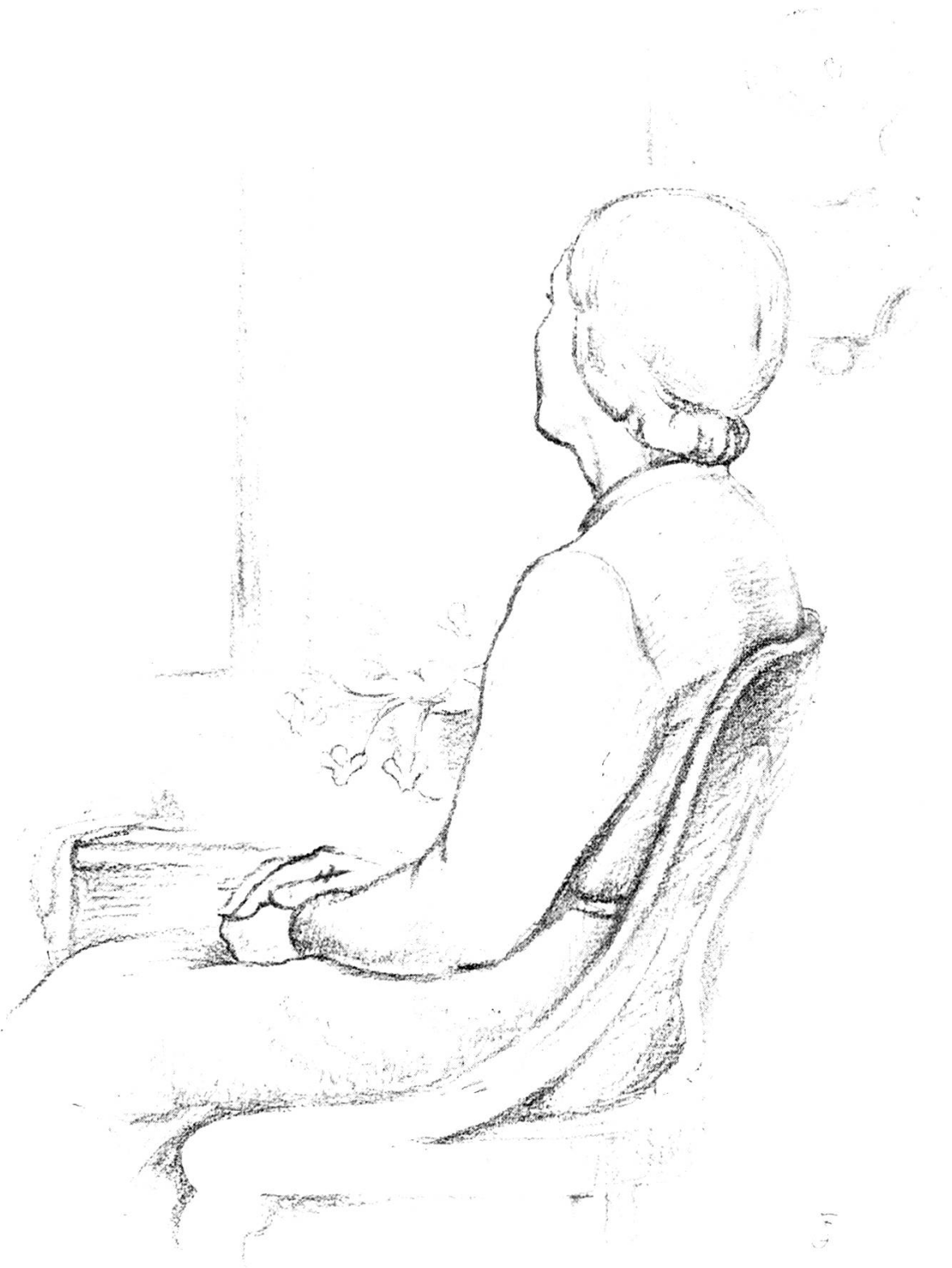
Nach einer Bleistiftzeichnung von Guido Fischer, Aarau