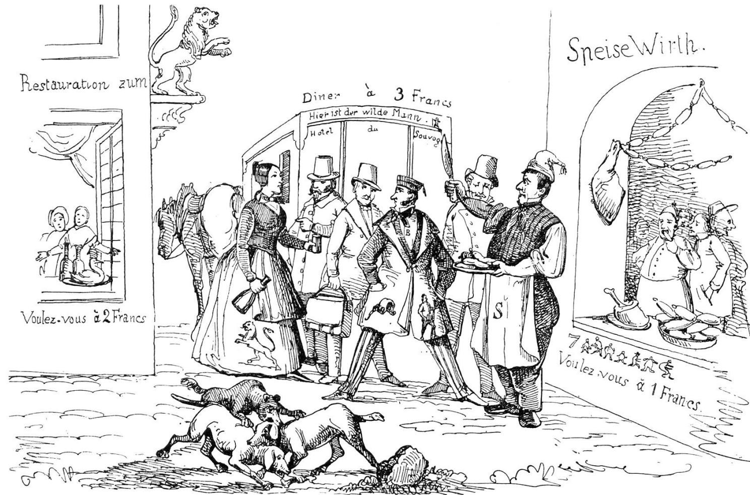
Wie die Wirthe in Aarau den ankommenden Fremden in Empfang nehmen und für ihre Bedürfnisse Sorge tragen.