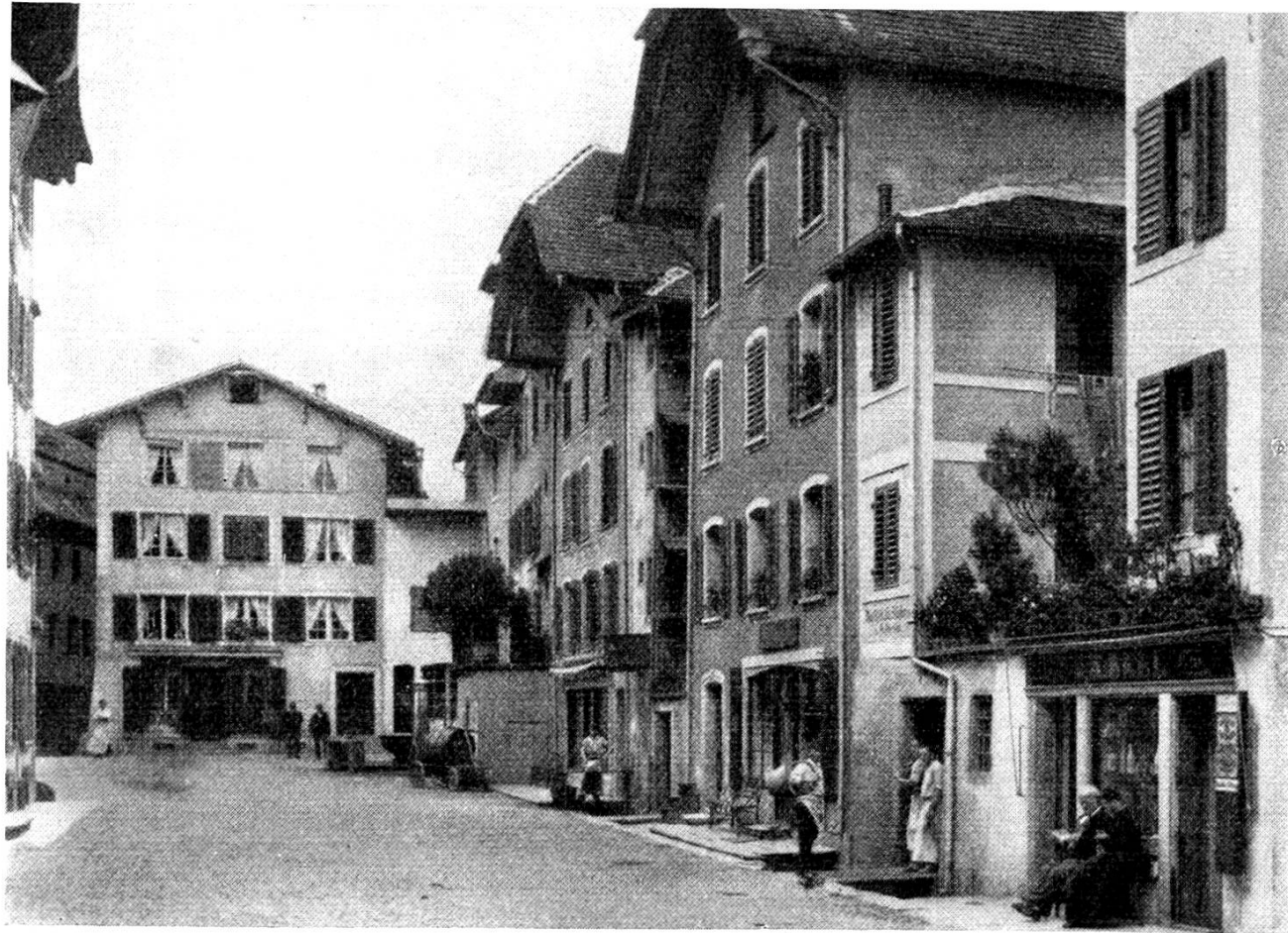
↑ In diesem Lokal (Parterre) befand sich die Postfiliale vom 17. Okt. 1859 bis 28. Febr. 1867