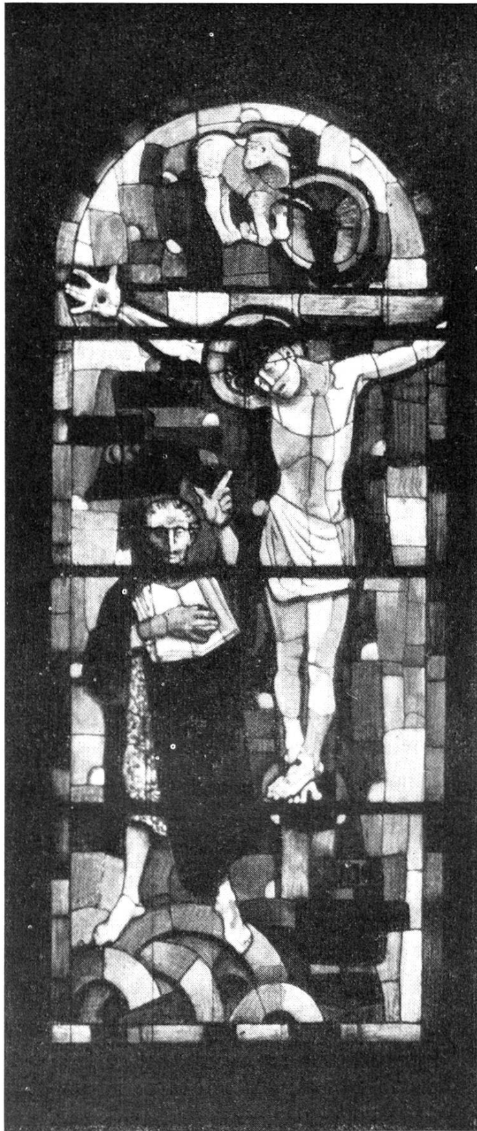
Kreuzigung mit Johannes

Cherfenster der Rapperswiler Kirche Maße: 3,45 m \times 1,30 m