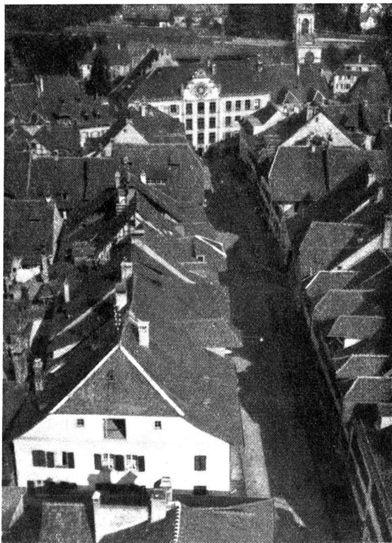
Photogr. Aufnahme durch Archit. G. Gysler-Frey von der Plattform des Turmgerüstes

In den Tagen vom 22. bis zum 26. August erstand unter der Leitung von Zimmermeister Joseph Deschger das Gerüst, das