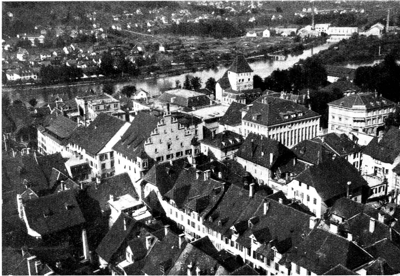
Photogr. Aufnahme durch Archit. G. Gysler-Frey von der Plattform des Turmgerüstes