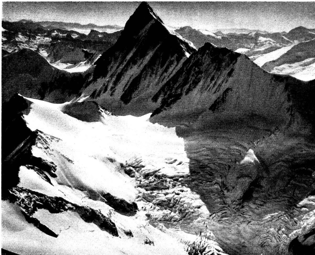
Finsteraarhorn von Nordosten (Aufstieg Meyers über den Grat links im Bilde)