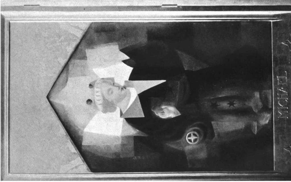
ANBETUNG (linker Flügel)