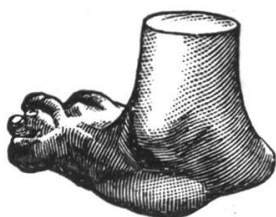
NUR NACH MASS

RENNWEG 29 / TELEPHON S. 4160 / ZÜRICH 1