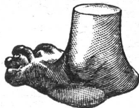
NUR NACH MASS

RENNWEG 29 / TELEPHON S. 4160 / ZÜRICH 1