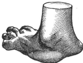
NUR NACH MASS

RENNWEG 29 / TELEPHON S. 4160 / ZÜRICH 1