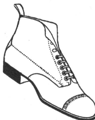
„Commodore“ der bequeme, rahmengenähte Strapazierstiefel