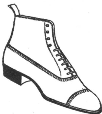
„Yale“ der elegante Rahmenstiefel