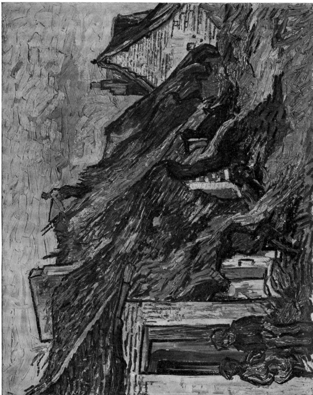
VAN GOGH — Strohdächer in Auvers Kunsthhaus Zürich