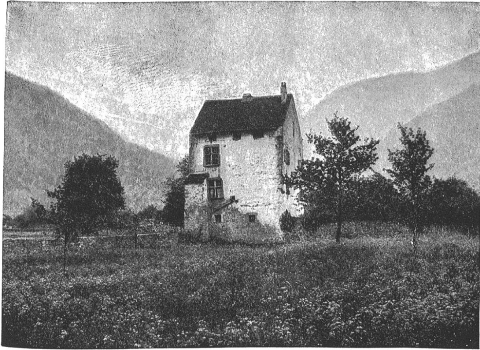
Das Haus Zumbrunnen, genannt „Zu allen Winden“, südwestlich von Altdorf (um 1500).