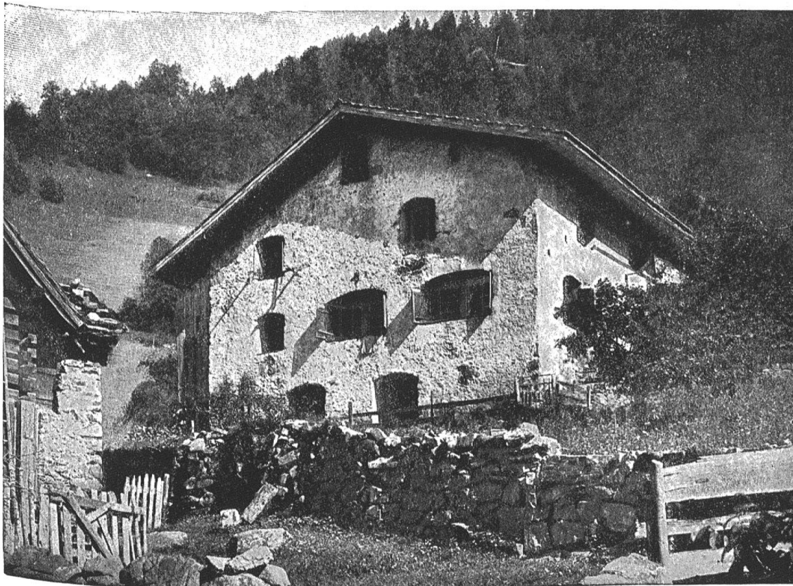
Das Steinhaus zu Trudelingen, östlich von Bürglen, erbaut um die Mitte des XVI. Jahrhunderts.