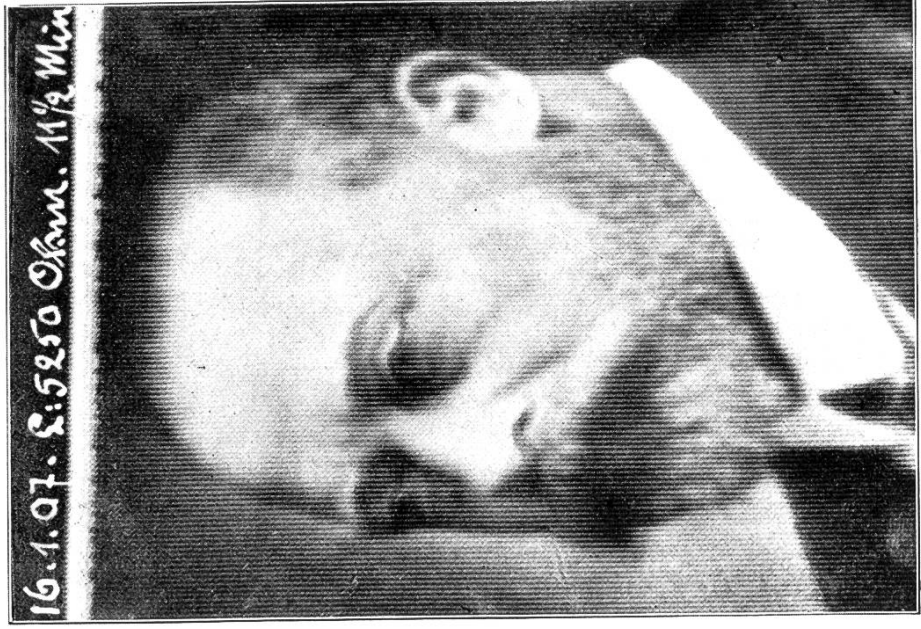
Abb. 5. FERNPHOTOGRAPHIE SYSTEM KORN