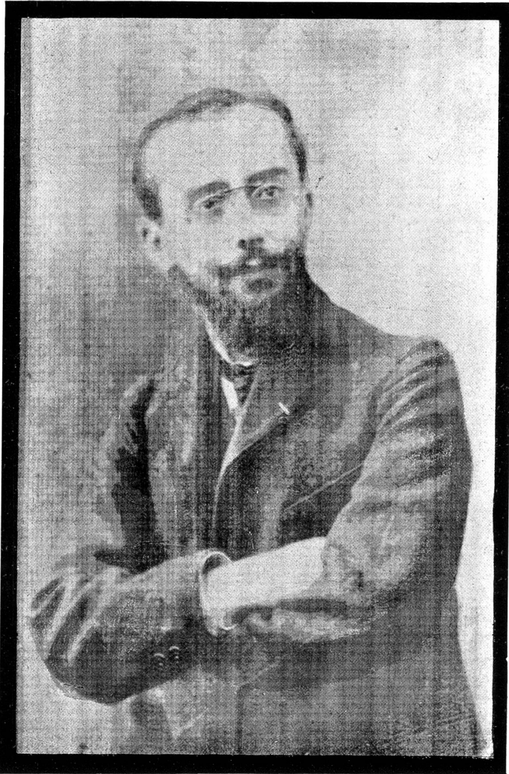
Abb. 7. FERNPHOTOGRAPHIE NACH BELIN