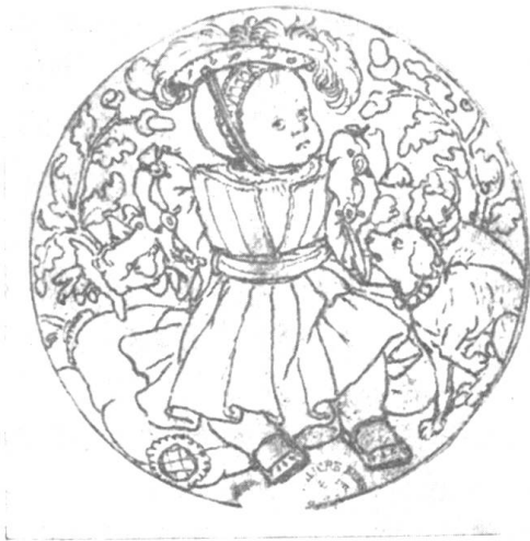
Hans Holbein d. J. Medaillon Bildnis des Prinzen von Wales

mit seinem handlichen Format und dem vorzüglich klaren Druck repräsentiert sich das Ganze als ein Buch, das für jeden willkommene künstlerische Anregung enthält und infolge seines bleibenden Wertes nie ohne Befriedigung aus der Hand gelegt werden wird.