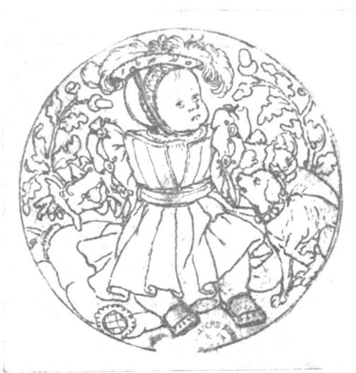
Hans Holbein d. J. Medaillon Bildnis des Prinzen von Wales

mit seinem handlichen Format und dem vorzüglich klaren Druck repräsentiert sich das Ganze als ein Buch, das für jeden willkommene künstlerische Anregung enthält und infolge seines bleibenden Wertes nie ohne Befriedigung aus der Hand gelegt werden wird.