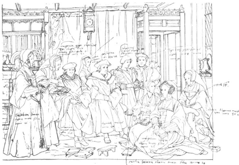
Hans Holbein d. J.