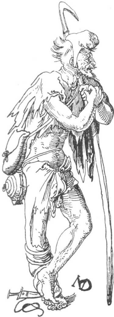
Niklaus Manuel Der Bettler

duktionsverfahren sorgten dann für weitere Verbreitung anerkannter Kunstwerke. Heute gewinnt die Menge in Museen und Sammlungen größtenteils kostenlos unmittelbare Fühlung mit den Schöpfungen der bedeutendsten Künstler aller Zeiten und kann zu niedrigen Preisen fast alles in einwandfreien Reproduktionen mit nach Hause nehmen zu sorgsamem Einleben und ungestörtem Genuß. Früher las man über Kunst und Künstler; jetzt hat diese literarische Kunstkennntnis, einseitig beeinflusst durch Geschmack und Geschick der jeweiligen Interpreten und nur selten erläutert durch Kupfer oder Holzschnitte, dem direkten Verkehr zwischen Kunstwerk und Publikum weichen müssen. Wir kaufen uns billige Bücher, angefüllt mit guten Illustrationen, denen kurze objektive, kritische und historische Erklärungen beigegeben sind.