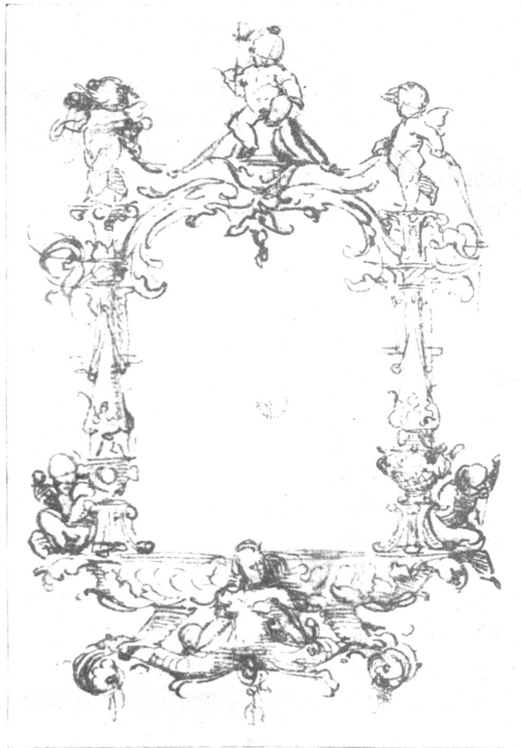
Hans Holbein d. J.

Die alte Benennung der beiden Zeichnungsfolgen als „Schreibbüchlein“, sowie ihr Inhalt weisen darauf hin, daß sie keine Skizzenbücher darstellen, wohl aber Vorlagehefte, aus denen nicht nur Manuel selbst und seine Auftraggeber, sondern auch Mitarbeiter und Lehrlingen Vorteil ziehen konnten; und bei genauerm Zusehen ergibt sich, daß die beiden, etwa 1518 entstandenen Bildererien mit ganz besonderer Berücksichtigung der einheimischen Glasmalerei entworfen worden sind. Wahrscheinlich hatte der Meister die Absicht, beide Musterbücher im Holzschnitt zu vervielfältigen; daß aber auch ohne die Verwirklichung dieser Idee die „Schreibbüchlein“ bei Zeitgenossen und künstlerischen Nachfahren vielfach Benützung gefunden haben, zeigen zwei Glasgemälde in der Folge des Meisters