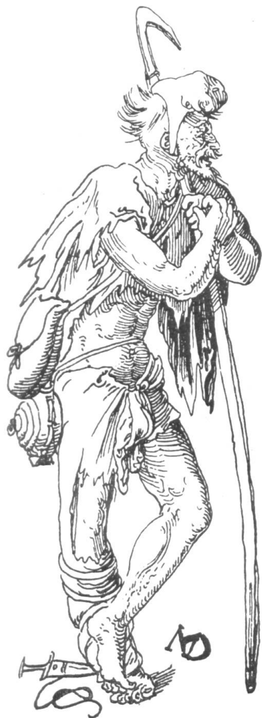
Niklaus Manuel Der Bettler

duktionsverfahren sorgten dann für weitere Verbreitung anerkannter Kunstwerke. Heute gewinnt die Menge in Museen und Sammlungen größtenteils kostenlos unmittelbare Fühlung mit den Schöpfungen der bedeutendsten Künstler aller Zeiten und kann zu niedrigen Preisen fast alles in einwandfreien Reproduktionen mit nach Hause nehmen zu sorgsamem Einleben und ungestörtem Genuß. Früher las man über Kunst und Künstler; jetzt hat diese literarische Kunstkenntnis, einseitig beeinflusst durch Geschmack und Geschick der jeweiligen Interpreten und nur selten erläutert durch Kupfer oder Holzschnitte, dem direkten Verkehr zwischen Kunstwerk und Publikum weichen müssen. Wir kaufen uns billige Bücher, angefüllt mit guten Illustrationen, denen kurze objektive, kritische und historische Erklärungen beigegeben sind.