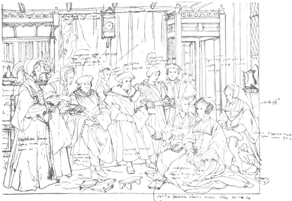
Hans Holbein d. J.