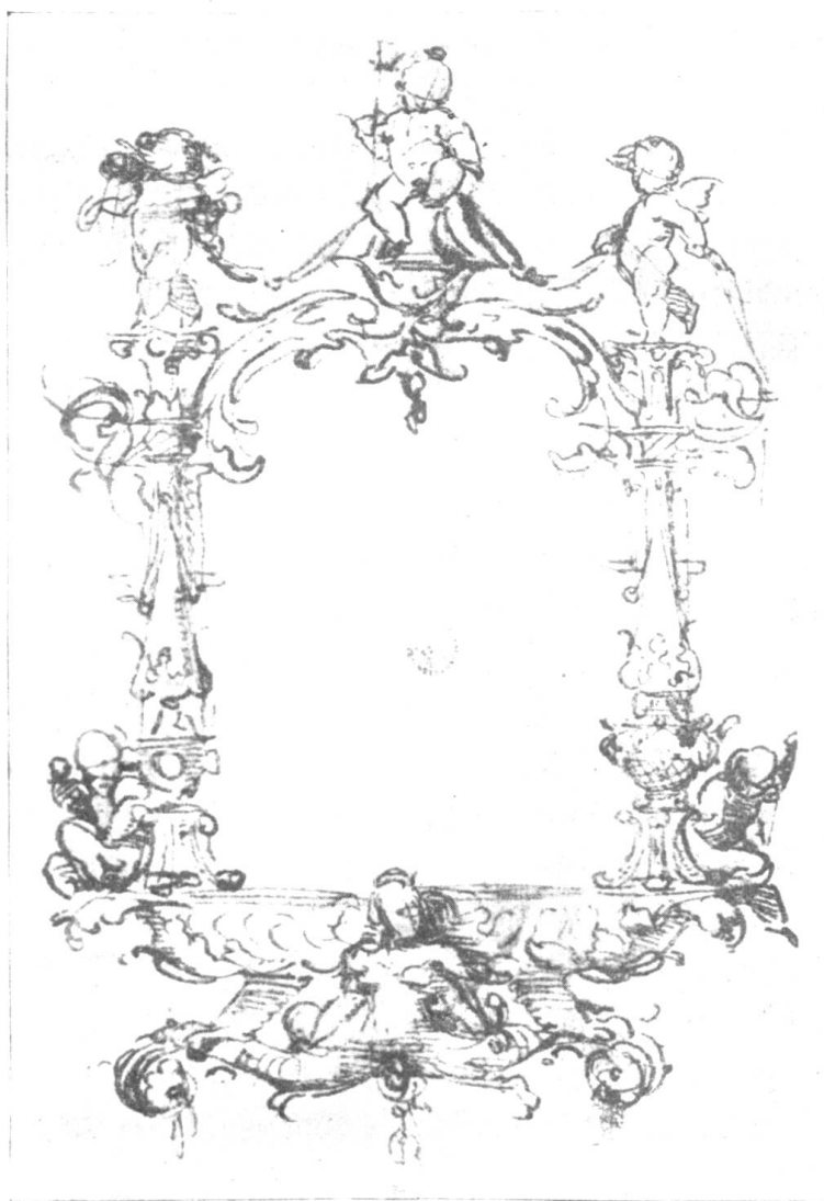
Hans Holbein d. J.

Die alte Benennung der beiden Zeichnungsfolgen als „Schreibbüchlein“, sowie ihr Inhalt weisen darauf hin, daß sie keine Skizzenbücher darstellen, wohl aber Vorlagehefte, aus denen nicht nur Manuel selbst und seine Auftraggeber, sondern auch Mitarbeiter und Lehrlingen Vorteil ziehen konnten; und bei genauerm Zusehen ergibt sich, daß die beiden, etwa 1518 entstandenen Bildererien mit ganz besonderer Berücksichtigung der einheimischen Glasmalerei entworfen worden sind. Wahrscheinlich hatte der Meister die Absicht, beide Musterbücher im Holzschnitt zu vervielfältigen; daß aber auch ohne die Verwirklichung dieser Idee die „Schreibbüchlein“ bei Zeitgenossen und künstlerischen Nachfahren vielfach Benützung gefunden haben, zeigen zwei Glasgemälde in der Folge des Meisters