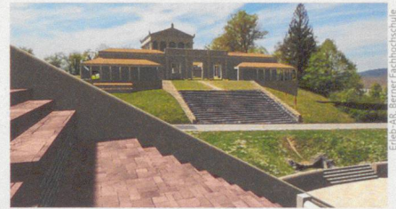
So sah der Schönbrühl-Tempel zur Römerzeit aus.

Moser Beat: «26malSchweiz. Wissenswertes, Charakteristisches, Sonderbares» BEMO Verlag, Sissach 2021 ISBN 978-3-033-08506-0