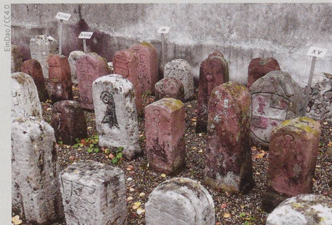
Alte Grenzsteine innerhalb der Ringmauer der Wehrkirche St. Arbogast in Muttenz.

Die Ausgabe 2/2022 erscheint Anfang April mit dem Schwerpunktthema «Gemeinden».