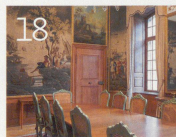
Der Basler Bürgerratssaal