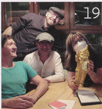
Erster Preis für die meisten richtigen Antworten im Pubquiz: der goldene Garten-zwerg