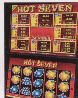
Spielsucht ist eine Krankheit.