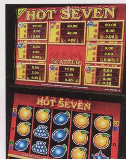
Spielsucht ist eine Krankheit.