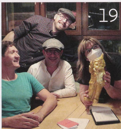
Erster Preis für die meisten richtigen Antworten im Pubquiz: der goldene Gartenzweig