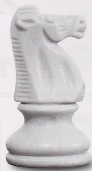
Schach: Mit Strategie und Konzentration