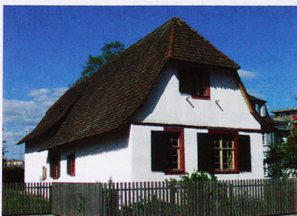
Fischerhaus Bürgin in Kleinhüningen

Datum/Zeit Mo, 22. März 16.30–17.30 Uhr Ort Basel Leitung Zoologischer Garten Basel Besonderes gut zu Fuss Kosten CHF 25.–, inkl. Eintritt Anmeldung bis 1. März