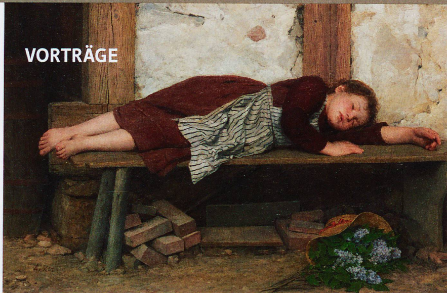
Schlafendes Mädchen auf einer Holzbank. Albert Anker (1831–1910)