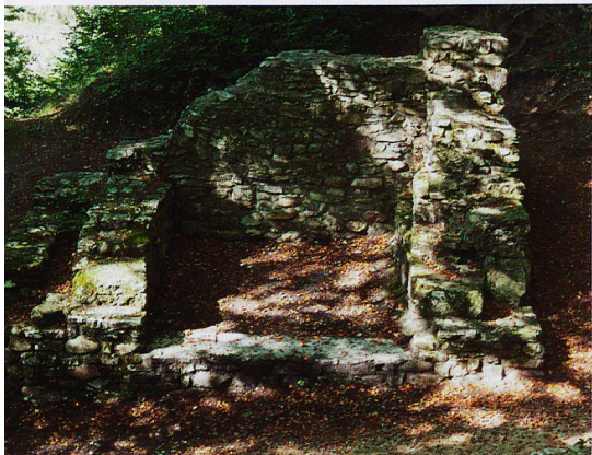
Tor der Riburg «Bürkli», Teil der spätrömischen Rheinbefestigung, in Möhlin