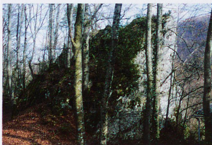
Die Ruine Alt-Biederthal befindet sich in der Gemeinde Burg im Leimental.