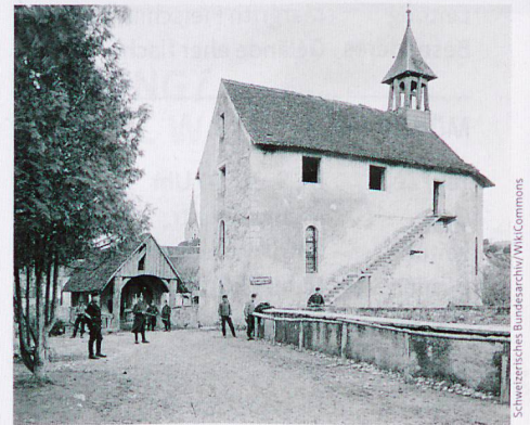
Die Kapelle St. Oswald in Zwingen diente im Ersten Weltkrieg als Soldatenstube.

Treffpunkt 09:50 h, Basel SBB (Bahnhofshalle) Rückreise 2× stündlich ab Lupsingen oder Büren Verpflegung Picknick, bei Regen Restaurant Leitung Nik Pfister, 079 724 33 08 n.gasser.1@gmx.ch Anmeldung bis 14. März