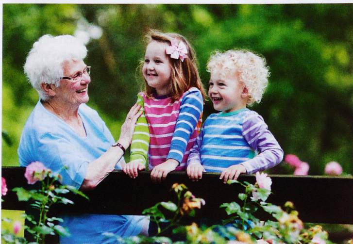
Die Kinder der Tochter haben unterschiedliche Väter? Das neue Erbrecht trägt den veränderten Familienformen Rechnung.

Des einen Leid ist des anderen Freud: «Die Möglichkeiten, aussenstehende Personen oder etwa gemeinnützige Institutionen zu begünstigen, werden infolge der gekürzten erbrechtlichen Pflichtteile zunehmen», betont Sauter. So können neu etwa Konkubinatspartner ohne (pflichteilgeschützte) Kinder einander in Zukunft den ganzen Nachlass vererben. Nach aktuell geltendem Recht ist dieser Nachlass duetlich geringer: Wenn die Eltern des Erblassers noch leben, erhält der