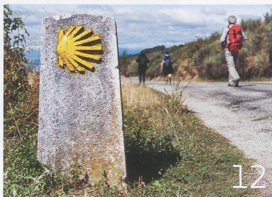
Auf dem Pilgerweg nach Santiago de Compostela