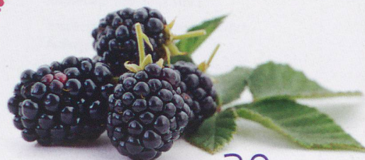
Pflanzenfarben selbst machen