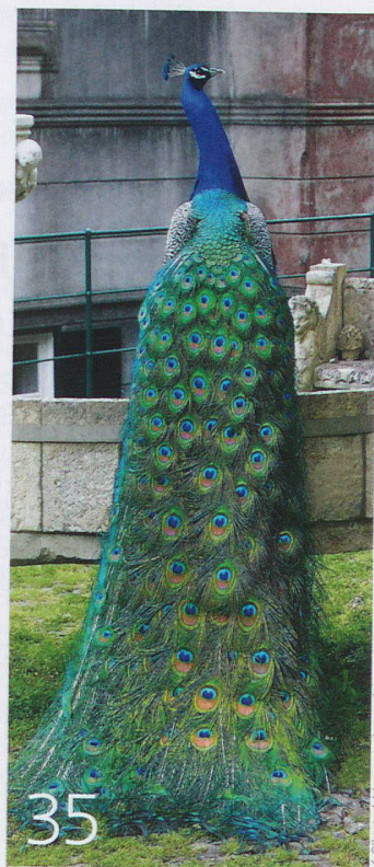
Farbenpracht im Tierreich ▶