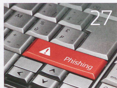
Gefährliche Tasten ...

bajour 21 Von analogen zu digitalen News