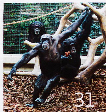
Familienbande bei den Primaten

Titelfoto: Simone Forcart-Staehelin